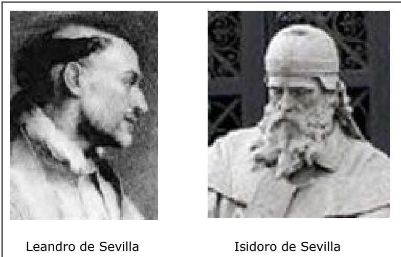
Leandro de Sevilla

Het was dezelfde Recesvinto die het vele wetgevende werk van zijn voorgangers en hemzelf bundelde in een Liber iudiciorum (654), de kroon op een voor die tijd in Europa ongehoorde poging om de eenheid van land en recht te doen samenvallen. Vóór de Visigotische periode bestond er niet zoiets als het concept van "Spanje", er waren slechts provincies die elk op zich onder Romeins bestuur stonden. Maar de Visigoten slaagden erin om het gehele Iberisch