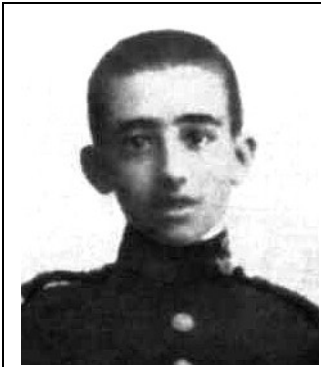
Franco als cadet, 1907

Omdat er voor Franco geen plaats was bij de marine, ging hij in 1907 naar de Militaire Academie in Toledo, waar hij vanwege zijn schriële gestalte (1.64m) en zijn hoge stem "Franquito" werd genoemd. Eén van zijn jaargenoten was Juan Yagüe, een toekomstige