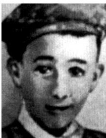
Franco in 1900

Hij kon het noch goed verstaan, noch behoorlijk spreken.