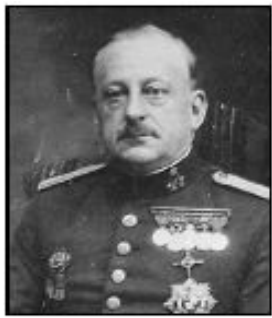
Miguel Primo de Rivera

Een krant kopte: "De bruiloft van een heroïsche Caudillo ". Het was voor het eerst dat deze titel ( Caudillo betekent letterlijk aanvoerder of leider) werd gebruikt.