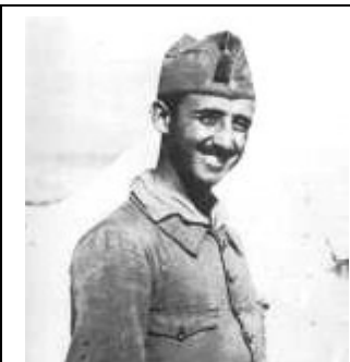
Franco in Marokko 1920

In 1917 braken er sociale conflicten uit en werd er gestaakt in Asturië. Deze staking werd bloedig neergeslagen. Eén van de colonnes stond onder bevel van Franco die een beslissende rol speelde in het herstellen van de orde. In datzelfde jaar ontmoette Franco zijn toekomstige vrouw Carmen (Maria del Carmen Polo y Martínez Valdés), vijftien jaar oud. De familie moest