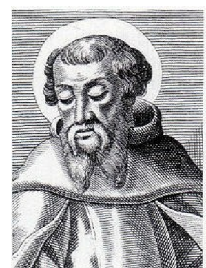
Iraeneus van Lyon (130-202)