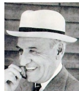
José Ortega y Gasset 1883 - 1955

In 1903 keerde Azaña terug naar Alcalá om de familiezaken op orde te brengen. Die bestonden uit een boerderij, een steenfabriek en de plaatselijke elektriciteitscentrale. Daar dit alles geen succes werd, begon hij in 1909 zijn ambtelijke loopbaan op het Ministerie van Justitie waar hij twintig jaar heeft gewerkt. In die periode ontwikkelde hij zijn politieke denkbeelden en sloot hij zich aan bij de in 1912 opgerichte Partida Reformista , een republikeinsgezinde beweging die een seculiere staat voorstond en een eind wilde maken aan het Caciquismo in Spanje, aan de macht van de plaatselijke heersers ( de caciques ) die de bevolking uitbuiten en hun stemmen kochten om aan de macht te kunnen blijven. De beroemde filosoof José Ortega y Gasset, auteur van het boek "De opstand der horden", maakte eveneens deel uit van deze partij.