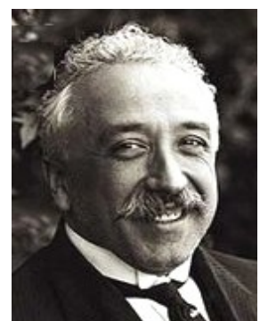
Niceto Alcalá Zamora 1880-1949

Als er één man is geweest die misschien het uitbreken van de Spaanse Burgeroorlog had kunnen voorkomen, dan was dat Manuel Azaña, achtereenvolgens Minister van Oorlog, Premier en President van Spanje in de periode die volgde op het uitroepen van de Tweede Republiek in 1931 tot aan het einde van de oorlog in 1939. Intellectueel en schrijver, die voor zijn biografie van de Spaanse literator Juan Varella in 1926 onderscheiden werd met een literaire prijs ( Premio Nacional de Literatura ) en door vriend en vijand gerespecteerd werd als een uiterst bekwaam redenaar.