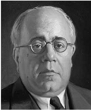
Manuel Azaña 1880-1940