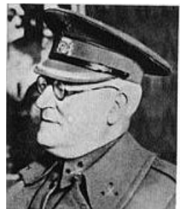
José Miaja 1878 - 1958

heeft gespeeld in de uiteindelijk succesvolle verdediging van de stad. Niet onbelangrijk daarbij was overigens dat de complete aanvalsplannen van de opstandelingen werden aangetroffen op een dode officier, wat betekende dat Rojo precies wist op welke plaatsen hij zijn verdediging moest concentreren.