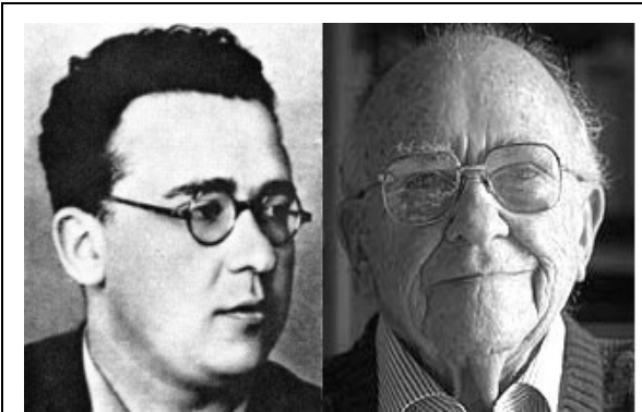
Santiago Carrillo 1915

Leden van de Junta de Defensa werden verantwoordelijk gesteld voor het beheer van portefeuilles als Bevoorrading, Oorlog, Oorlogsindustrie e.d. De zorg voor de openbare orde werd in handen gelegd van Santiago Carrillo Solaris, lid van de Juventudes Socialistas Unificadas (jongerenbeweging van de socialistische en communistische partij), opgericht in