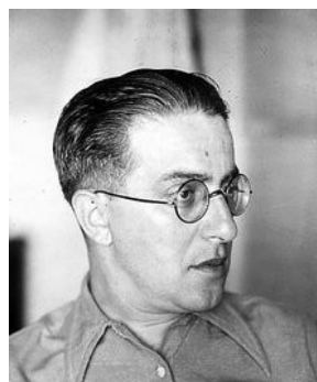
Michael Koltsov 1989 - 1940 of 1942

Dit recht van de straat heerste ook in de gevangenis van Madrid, waar duizenden sympathisanten van rechts werden vastgehouden. Zij vormden voor de militaire opstandelingen, die onder leiding van Franco in vier legercolonnen de hoofdstad dicht genaderd waren, de zogenaamde vijfde colonne, waarvan verwacht werd dat zij bij de verovering van de stad een rol zou kunnen spelen. Dit was ook de vrees van Michael Koltsov, correspondent voor de Russische krant de Pravda in Spanje, maar achter de schermen een man met veel macht die de Spaanse regering adviseerde op instigatie van de Russische communistische partij. Koltsov, die meermalen de linkse regeringsleiders erop gewezen heeft dat deze vijfde colonne