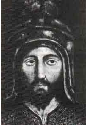
Boabdil 1459? - 1527

Een periode van verwarring brak aan, niet alleen omdat Granada zich nog steeds van twee kanten bedreigd wist, maar ook omdat er burgeroorlogen uitbraken die het land ernstig verzwakten. De kracht van de christenen nam alleen maar toe, vooral door het samengaan van de koninkrijken Aragón en Castilië in 1479 door het huwelijk van Fernando en Isabel, de Reyes Católicos , die, gestimuleerd door de clerus, zich in naam van het christelijk geloof ten doel stelden Spanje geheel te zuiveren van de islam.