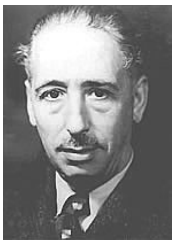
Lluís Companys 1882-1940

Voor de opening van de Cortes (het Spaanse parlement) op 1 oktober 1934 verklaarde Gil Robles dat de CEDA geen steun meer zou geven aan een minderheidskabinet en dat zijn partij deel wilde uitmaken van een bredere coalitie. Binnen de CEDA was men zich bewust van het risico: het uitbreken van een linkse opstand. Leiders van de PRR pleitten voor Lerrox als premier. Alcalá Zamora kon weinig anders dan de CEDA toelaten tot een nieuw kabinet, want voor ontbinding van het parlement waren geen formele argumenten aanwezig. En dus traden drie 'cedisten' toe tot de regering. Op 4 oktober, toen het nieuws over de nieuwe samenstelling van de regering was doorgedrongen, gaf Azaña de volgende reactie: 'Izquierda Republicana (de links Republikeinse partij van Azaña) verklaart dat het monsterachtige feit van de overgave door de regering van de republiek aan haar vijanden, een daad van verraad is [...] en bevestigt zijn beslissing om met inzet van alle mogelijke middelen de Republiek te verdedigen.' Vergelijkbare verklaringen kwamen van andere linkse partijen. In de avond van 4 oktober begon de opstand onder leiding van de Alianza Obrero. De voorbereiding ervan leek degelijk te zijn geweest en de opstandelingen waren goed bewapend. Er werd een staking uitgeroepen op nationale schaal.