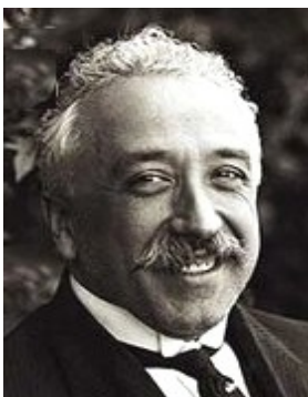
Niceto Alcalá Zamora 1880-1949

De opstand die begin oktober 1934 ontketend werd door links-revolutionaire krachten en die door het wettig gezag vrij eenvoudig werd neergeslagen, behalve in Asturië waar het tot een bloedige confrontatie kwam, wordt wel de eerste veldslag van de Spaanse Burgeroorlog genoemd. Daar zit zeker een kern van waarheid in, zij het dat de politieke situatie in 1934 nogal verschilde van die van juli 1936, toen de Burgeroorlog echt losbarstte. In 1934 was er een rechtse regering die voorkwam dat links via een revolutie zoals die in Rusland van 1917, de macht zou grijpen, terwijl in 1936 er een linkse regering zetelde die in feite niets deed om het revolutionaire geweld te keren waarna het leger in opstand kwam.