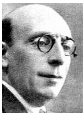
Ricardo Samper 1881-1938

Begin februari ontstond er onder het toezicht van Largo Caballero een coördinerend revolutionair comité, waarin de PSOE, de UGT en de Jonge Socialistische vertegenwoordigd waren met als opdracht het technisch en financieel organiseren van een revolutionaire opstand. Het comité verklaarde dat die opstand alle kenmerken van een burgeroorlog zou moeten hebben.