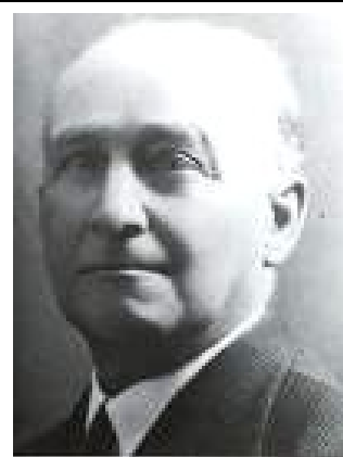
Francisco Largo Caballero 1869-1946