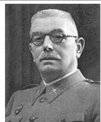
Domingo Batet 1875-1937

In Madrid begon een algemene staking op 5 oktober maar die leidde slechts tot enkele willekeurige terroristische acties tegen de middenklasse. De UGT nodigde de politie en militairen uit zich aan te sluiten, wat geen succes had en op 8 oktober werd er door de veiligheidstroepen al een eind aan de opstand in de hoofdstad gemaakt.