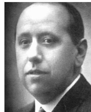
José María Gil Robles 1898-1980

formeren van een kabinet niet op aan de leider van de CEDA, Gil Robles, maar aan Alejandro Lerroux die de PRR (Partido Republicano Radical) aanvoerde. Lerroux vormde een minderheidsregering van vrijwel uitsluitend vertegenwoordigers van zijn eigen partij en ging regeren met steun van de CEDA. Alcalá Zamora, die eerder een ouderwetse regent dan een democraat in hart en nieren kon worden genoemd, manipuleerde op deze manier de rechtse krachten buiten de daadwerkelijke macht. Zijn angst voor de dreigingen van links, dat ten koste van alles probeerde te voorkomen dat de CEDA regeringsmacht zou krijgen speelde daarbij een rol. Macht die de CEDA indirect overigens wel kon uitoefenen, want voor het gedogen van de regering Lerroux moest uiteraard een prijs worden betaald in termen van het tegemoet komen aan rechtse verlangens zoals het terugdraaien van maatregelen die het vorige, linkse bewind had genomen: de onderwijshervormingen, maatregelen tegen de kerk, landhervorming en een aantal arbeidswetten. Ook werd besloten amnestie te verlenen aan de deelnemers aan de opstand van generaal Sanjurjo in 1932.