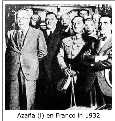
Azaña (l) en Franco in 1932

In april 1931 deed koning Alfons XIII afstand van de troon toen bij gemeenteraadsverkiezingen bleek dat in de grote steden de monarchistische aanhang was verdwenen. Spanje werd voor de tweede keer een republiek en de macht kwam in handen van een linkse regering waarin de republikein Manuel Azaña als minister van Oorlog formeel de superieur was van Franco. In plaats van Franco die positie te gunnen die hij innam in de jaren ervoor heeft Azaña voortdurend pogingen ondernomen om diens speelruimte te verkleinen, iets wat Franco niet kon verkroppen. In 1931 was Franco erop gebrand benoemd te worden tot Hoge Commissaris van Marokko, maar Azaña passeerde hem waarmee hij een kans liet lopen om Franco's loyaliteit te winnen. Ook het opheffen in juni 1931 van de militaire academie van Zaragoza, waaraan Franco leiding gaf, zette veel kwaad bloed evenals zijn benoeming in februari 1933 tot commandant generaal van de Balearen, een positie die hij beneden zijn waardigheid achtte.