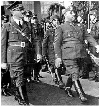
Franco en Hitler Hendaya 1940

Persoonlijke contacten tussen Franco en de Duitse nazi's verliepen stroef. De Duitsers zagen Franco als een onbeduidende figuur en het was uitgerekend Himmler die tijdens een bezoek aan Spanje in oktober 1940 zich ontsteld toonde over de repressie en stelde dat je militante arbeiders beter in je nieuwe systeem kunt integreren dan ze uit te roeien. Ook de ontmoeting tussen Hitler en Franco in diezelfde maand in de Spaans-Franse grensplaats Hendaya verliep niet volgens Franco's wens. Franco zag het als historisch moment, maar Hitler wekte de indruk dat hij iets anders aan zijn hoofd had dan een deal met Franco. Franco's omstandige pleidooi voor coöperatie met betrekking tot zijn Marokkaanse ambities, zijn betogen en ook zijn verschijning - de impressie wekkend dat hij van gelijk statuus was als de führer - irriteerde Hitler mateloos.