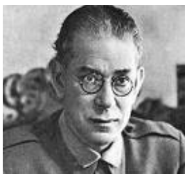
Emilio Mola Vidal 1887 - 1937

Na de verkiezingen raakte Spanje in een spiraal van geweld tussen links en rechts. In die toenemende chaos werd het initiatief tot een militaire opstand genomen door generaal Emilio Mola die zich verzekerd wist van een aantal getrouwen, maar toen nog niet van Franco die zijn diensten aan de regering aanbood om de chaos te bedwingen, waarmee hij aangaf dat het complot van Mola zou kunnen worden voorkomen. Of hij dit deed uit ultieme loyaliteit aan het gezag