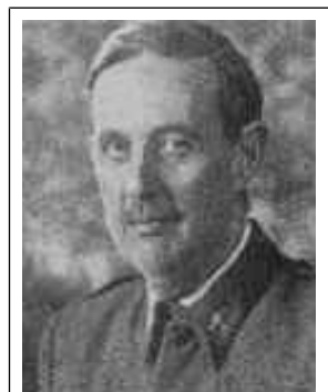
Alfredo Kindelán 1879 - 1962

In de zomer en herfst van 1939 rekende Franco af met een aantal hoge militairen die hem altijd gesteund hadden, maar die hij beschouwde als concurrenten. Zo werd generaal Kindelán, de man die Franco in 1936 voordroeg als Caudillo, maar altijd gepleit had voor herstel van de monarchie, weggezet via een benoeming op de Balearen, net zoals Franco zelf in 1933 was overkomen. Zijn eigen positie verstevigde hij met de Ley de la Jefectura del Estado op 8 augustus waardoor hij de bevoegdheid kreeg wetten uit te vaardigen zonder het kabinet te raadplegen. Dat gaf hem een machtspositie die vergelijkbaar is met die van de middeleeuwse koningen.