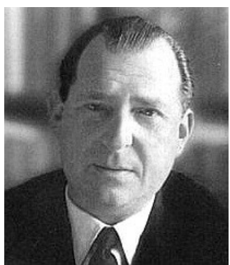
Don Juan de Borbón y Battenberg 1913 - 1993

Franco ontwikkelde een passie voor film (hij had een privébioscoop) en in die periode schreef hij het script voor de film RAZA. De film geeft in elk geval wel zijn opvattingen over hoe Spanje geregeerd zou moeten worden: zoals een vader regeert over zijn gezin, streng maar rechtvaardig.