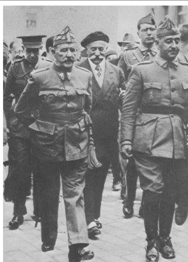
Franco (r) in Burgos, 1936

Op 18 en 19 juli 1936 brak de militaire opstand uit die slechts gedeeltelijk lukte. Franco nam de leiding in handen van de aan hem loyale legereenheden in Marokko en met hulp van de Duitsers en Italianen werd een luchtbrug georganiseerd. Interessant is, dat Franco in de daaropvolgende strijd in het moederland het risico van mislukking uit de weg ging en niet uit was op snelle successen. Hij toonde zich iemand die voor zekerheid gaat, geen verlies wil incalculeren. Die houding werd hem door sommigen van zijn collega's niet in dank afgenomen, maar het getuigt wel van een bepaald strategisch inzicht waardoor hij zich gedurende de gehele Burgeroorlog zou laten leiden. In de eerste maanden van de oorlog bleek tevens dat Franco eenmaal ingenomen landsdelen voorgoed wilde 'bevrijden' van linkse elementen: 'In een Burgeroorlog is een systematische bezetting van territoria, gepaard aan de noodzakelijke zuivering te verkiezen boven een snelle opmars van legers dat een met vijanden geïnfecteerd land achterlaat.' Dit schoonmaken gebeurde op meedogenloze wijze: De opstandelingen executeerden systematisch hun tegenstanders.