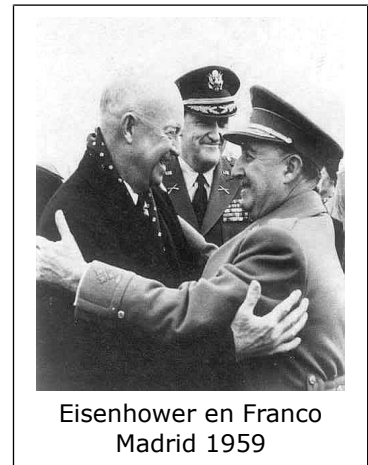
Eisenhower en Franco Madrid 1959

de VS steun aan toetreding van Spanje tot de Verenigde Naties in ruil voor luchtmachtbases op het Iberisch schiereiland. Bij zijn inauguratie in januari 1953 benadrukte president Eisenhower het belang van goede relaties met Spanje en in september van datzelfde jaar werd een defensiepact tussen Spanje en de VS ondertekend. Maar Spanje werd wel buiten de Nato gehouden. Toetreding tot de verdragsorganisatie werd pas werkelijkheid in 1982, ruim na Franco's overlijden. Maar Franco beleefde wel een hoogtepunt in zijn buitenlandse carrière, met de acceptatie van een uitnodiging aan Eisenhower voor een bezoek aan Madrid. Dat vond plaats in december 1959. Ook bij het Vaticaan boekte Franco succes. Reeds in 1948 startte overleg over een concordaat met de kerk dat in 1953 werd bekrachtigd (zie het artikel over het Nationaal-Katholicisme op deze site).