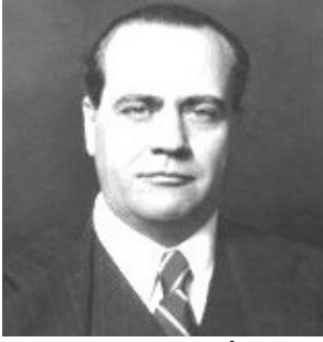
Juan Negrín 1892 - 1956

De socialist Juan Negrín ging daarin heel ver: hij stelde de president voor de verkiezingen te annuleren en een nieuwe regering te vormen uitsluitend bestaande uit vertegenwoordigers van de links-republikeinen met als opdracht de kieswet te wijzigen. De president wees dit absurde voorstel direct van de hand, maar beging de fout om niet de overwinnaar van rechts, de CEDA, een opdracht te geven tot formatie van een regering, maar te proberen om een centrumregering in het zadel te helpen. Daarmee handelde hij op zijn beurt tegen de regels van het democratische spel en werden de tegenstellingen in het land alleen maar vergroot.