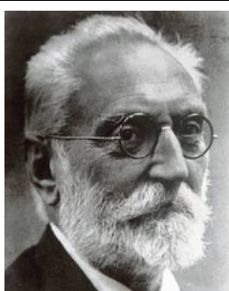
Miguel de Unamuno 1864 - 1936

In januari 1933 kwam het tot een onbeheerst treffen tussen de Guardia de Asalto en opstandige boerenarbeiders in het dorpje Casas Viejas in de buurt van Cádiz. Een dozijn arbeiders werd geëxecuteerd, wat leidde tot een scherp protest van zowel de rechtse oppositie als de anarchisten. Het prestige van Azaña liep door deze gebeurtenis een ernstige deuk op waarvan hij zich niet meer zou herstellen. De in april gehouden gemeenteraadsverkiezingen in