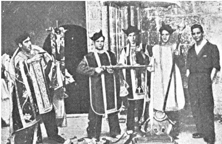
Militairen parodiëren een liturgie.

Rooms-katholieke rituelen en liturgieën en typisch kerkelijke uitingen als processies werden bespot en vervangen door wereldlijke versies. De botsingen tussen gelovigen en ongelovigen trokken diepe sporen in lokale gemeenschappen waar burgers die tot dan toe vreedzaam samenleefden elkaar met wederzijdse haat tegemoet traden.