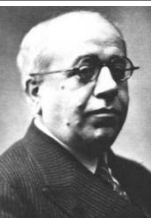
Manuel Azaña 1880-1940

Gelukkig bleef het niet bij de drastische secularisering van het onderwijs. Er werden langetermijnvoorstellen aangenomen om gratis openbaar onderwijs te verschaffen aan alle kinderen. Gezien het feit dat Spanje op dat moment met 65% anafabetisme beschouwd kon worden als een van de meest achtergebleven landen van Europa, was dat geen overbodige luxe. En hoewel veel rooms-katholieke onderwijzers verdwenen, leidden deze plannen op korte termijn tot een flinke toename van het aantal schoolgaande kinderen.