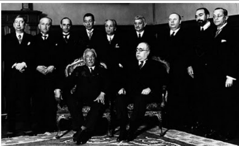
Het kabinet Azaña. Zittend: Alcalá Zamora en Azaña. Staand vlnr: Marcelino Domingo Sanjuán, Francisco Largo Caballero, Santiago Casares Quiroga, Luis de Zulueta Escolano, Álvaro de Albornoz y Liminiana, Luis Nicolau d'Olwer, Indalecio Prieto Tuero, Fernando de los Ríos Urruti, José Giral Pereira.

Na het aftreden van koning Alfons XIII in 1931 werd een voorlopige regering aangesteld die een nieuwe grondwet voorbereidde. In december van dat jaar werd deze grondwet aanvaard door het parlement. Tot president werd Alcalá Zamora benoemd en premier Azaña, die tevens minister van Oorlog was, presenteerde zijn kabinet bestaande uit links-republikeinen en socialisten. Dit kabinet nam de uitvoering van de in de grondwet verankerde hervormingsdoelen ter hand: ontvlechting van kerk en staat, uitbreiding van publieke werken, reorganisatie van het leger, modernisering van het onderwijs, verbetering van de positie van arbeiders en hervorming van de landbouw. Stuk voor stuk broodnodige hervormingen.