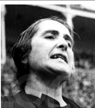
Dolores Ibárruri 1895 - 1989

verspreiden over de verdedigingsposities die in de stad waren opgeworpen. Largo Caballero koos in eerste instantie voor de eerste optie, maar liet zich overtuigen dat dat niet de beste zou zijn. In het open veld waren de goed geoefende en ervaren nationalistische strijdkrachten onoverwinnelijk gebleken, maar vechten om elke meter in en tussen talloze gebouwen in een stad is van een andere orde zoals ook zou blijken. Het waren vooral de communistenaan en hun sovjetadviseurs die erop hamerden dat de stad zo goed mogelijk verdedigd diende te worden en daar werd toe besloten. De communistische voorvechtster Dolores Ibárruri, ofwel La Pasionaria , sprak de bevolking moed in met haar gewelddadige toespraken en haar fameuze oproep iNo pasarán! (zij zullen er niet doorkomen), een oproep die ooit werd gebruikt in de Eerste Wereldoorlog bij Verdun.