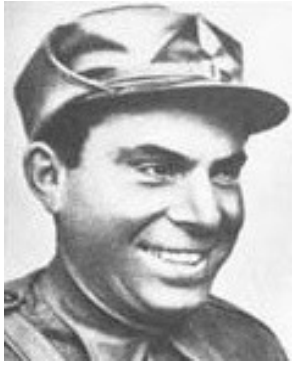
Buenaventura Durruti 1898-1936

De dagen daarna werden onophoudelijk aanvallen en tegenaanvallen ingezet, maar de nationalisten wisten niet door te breken. In deze strijd vochten ook regimenten mee van de Internationale Brigades die eigenlijk net te laat arriveerden. Deze brigades waren samengesteld op initiatief van de Sovjets en het waren dan ook de communisten die in de voortdurend gevoede propaganda-oorlog claimden dat het aan deze gevechtseenheden te danken was dat de aanval van de nationalisten werd afgeslagen. Een bewering die zwaar overdreven genoemd mag worden. Op 9 november verlegden de nationalisten hun aandacht naar Carabanchel waar in de man-tot-man-gevechten in de arbeiderswijken de soldaten van Franco niet alleen werden tegengehouden maar hen door de republikeinse verzetseenheden aanzienlijke verliezen werden toegebracht.