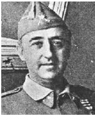
Francisco Franco in 1936

In september 1936 waren de nationalistische troepen van Franco Madrid, dat in handen was van de republikeinen, dicht genaderd en leek de val van de hoofdstad nabij. Niemand, vriend noch vijand in binnen- of buitenland twijfelde er eigenlijk aan dat Madrid snel in handen zou zijn van de militaire opstandelingen. Franco koos op dat moment niet voor een directe opmars naar Madrid, tot ergernis van een aantal van zijn officieren, maar hij besloot eerst het Alcázar van Toledo te ontzetten waarin zijn geestverwanten zich hadden teruggetrokken en dat belegerd werd door republikeinse troepen. Die actie werd succesvol afgesloten, maar het kostte tijd waarvan de republikeinen gebruik maakten om de verdediging van Madrid zo goed mogelijk te organiseren. Één van de vele vragen over de aard en het verloop van de Spaanse Burgeroorlog is dan ook naar wat de gevolgen zouden zijn geweest van een directe opmars van de nationalististen. Madrid zou dan wellicht zijn gevallen en daardoor, zo vlak na het uitbreken van de opstand in juli van datzelfde jaar, zou de oorlog misschien snel beëindigd zijn geweest. Misschien zouden duizenden levens gespaard zijn gebleven en Spanje geen dictatuur hebben gekend zoals die in 1939 ontstond. Er valt slechts over te speculeren.