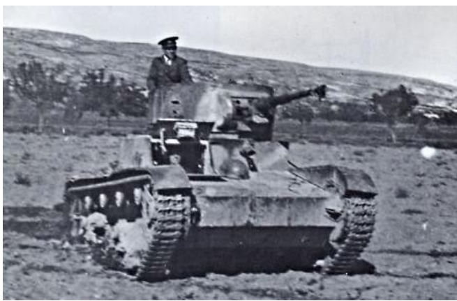
Een T-26 tank bij Seseña, oktober 1936

Begin oktober begon Franco aan zijn opmars naar Madrid. Hij had een troepenmacht ter beschikking waarvan 10.000 manschappen uit het zijn vertrouwde Marokkaanse leger de hoofdmacht vormden. Ook had hij de steun van door de Duitsers geleverde vliegtuigen: het Condorlegioen. Op 18 oktober veroverde hij de plaats Illescas, waarmee het front op dertig kilometer ten zuiden van Madrid kwam te liggen. Het bericht van deze verovering bereikte de republikeinse regering toen zij voltallig en in gezelschap van president Azaña de première bijwoonde van de film De Matrozen van Kronstadt , een Russische klassieker over de opstand van matrozen in 1921.