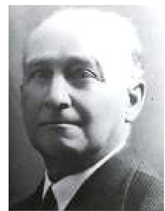
Francisco Largo Caballero 1869-1946