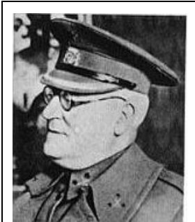
José Miaja 1878 - 1958

Miaja had een aanzienlijk aantal manschappen ter beschikking, veel meer dan het nationalistische leger, maar op dat moment slecht georganiseerd. Daarbij kwamen de Internationale Brigades en de door de Russen gezonden tanks, vliegtuigen met Russische piloten en een artillerie die veel krachtiger was dan die van Franco. En natuurlijk, de stad leverde een onuitputtelijk aantal vrijwilligers die bereid waren hun stad te verdedigen.