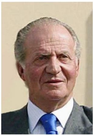
Juan Carlos I 1938

In de laatste jaren van de dictatuur ontstonden er problemen rond het toenemende aantal politieke optredens van nationalistische Baskische geestelijken en de uitvoering van het recht op presentatie dat, ondanks het verzoek van het tweede Vaticaans Concilie in 1962 hier afstand van te doen, door Franco werd gehandhaafd als een onvervreemdbaar recht. Na de dood van Franco zag koning Juan Carlos I direct af van het recht op presentatie. In 1979 sloot Spanje een vijfde concordaat met Rome waarin beide partijen hun onafhankelijke positie bepaalden onder het regime van de parlementaire monarchie.