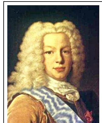
Ferdinand VI 1713-1759

tevredenheid van beide partijen geregeld werd voor het gehele koninkrijk. Het derde concordaat dateert uit 1851 en werd gesloten naar aanleiding van nieuwe ontwikkelingen zoals de opkomende secularisatie en de daarbij optredende sluiting van religieuze instituten en het fenomeen van uittreding van geestelijken uit het ambt. Destijds was de animositeit tussen de liberale regeringen en de Heilige Stoel groot, maar niettemin kwam het concordaat tot stand dat regelingen bevatte met betrekking tot kerkelijke bezittingen en de reorganisatie van bisdommen. Dit concordaat bleef gedurende tachtig jaar van kracht tot 1953, ondanks het opdoemen van ernstige problemen zoals de wettelijke vormgeving van de Eerste Republiek die in 1873 werd uitgeroepen en kwesties rond opvoeding en arbeidsverhoudingen. De Tweede Republiek, die ontstond in 1931 en van linkse snit was, negeerde het concordaat van 1851 en nam een aantal besluiten zoals de opheffing van de orde der jezuïten, verbod op bemoeienis van de Kerk met het onderwijs, het burgerlijk huwelijk etc. die de verhoudingen met het Vaticaan ernstig verstoorden. Een vierde concordaat kwam tot stand in 1953 tijdens de periode van franquistische dictatuur. Franco zag dit concordaat als een formele ondersteuning van zijn regime door de Heilige Stoel.