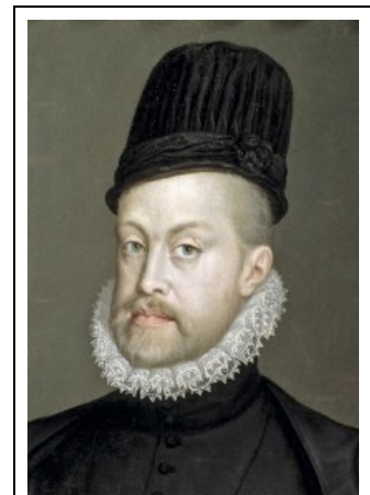
Filips II 1527-1598

patronaatsrecht toe te kennen over de deze gebieden waarmee zij formeel en definitief het bestuur over de kerk aldaar in handen kregen. Een tweede aanzienlijk concessie die de Heilige Stoel deed aan de Spaanse koning was het in 1508 verlenen van het patronaatsrecht over de overzeese koloniën in Midden- en Zuid-Amerika, destijds aangeduid met de term las Indias . Hoewel het beheer over deze gebieden toen nog meer hoop dan realiteit was, vormde de hooggespannen verwachting nieuwe rijkdommen aan te boren voldoende reden voor de paus om zich te verzekeren van steun van de koningen ter verbreiding van het geloof. De grote afstand tot de koloniën maakten een goede overeenkomst tussen wereldlijke en kerkelijke macht uiteraard noodzakelijk.