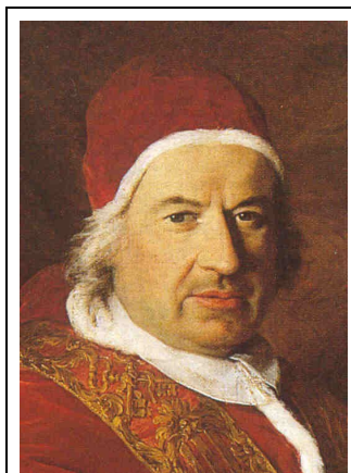
Benedictus XIV 1675-1758

Er zijn tussen het Spaanse koningshuis en de Heilige Stoel vijf concordaten afgesloten waarin zaken van gelijke interesse en competentiekwesties werden geregeld. Het eerste concordaat dateert van 1737 waarin getracht werd een serie van controverses tussen Filips V en Rome tot een oplossing te brengen. Dit concordaat staat bekend als het nutteloze concordaat, want het bevatte in feite niets anders dan akkoorden die in de toekomst gesloten zouden worden. In 1753 kwam het tweede concordaat tot stand, gesloten tussen koning Ferdinand VI en paus Benedictus XIV. Het was vooral aan deze paus, een getalenteerd jurist en onderhandelaar, te danken dat deze overeenkomst het licht zag. Voornaamste kwestie was die van het patronaatsrecht dat eindelijk na eeuwen van verwarring naar