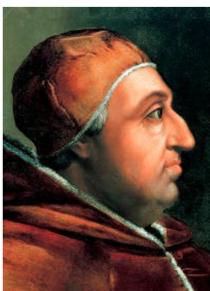
Alexander VI 1431-1503