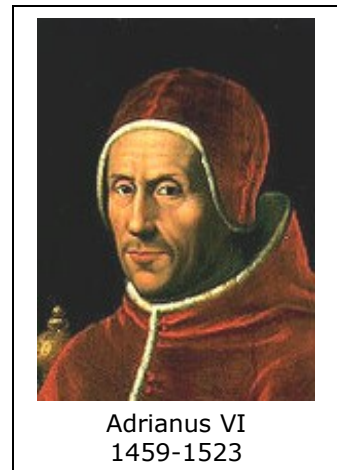
Adrianus VI 1459-1523

In 1565 verklaarde Filips II bij wet dat de Spaanse koning het recht van presentatie had over alle benoemingen van aartsbisschoppen, bisschoppen en andere prelaten. Filips baseerde zich daarbij op oude gewoontes en gebruiken. Maar hij kon niet verwijzen naar de pauselijke bul van 1486 waarin het patronaatsrecht beperkt was tot Granada en de Canarische eilanden en waarin zeker geen recht was verleend met betrekking tot het gehele koninkrijk. In feite beriep Filips II zich op rechten die zijn vader, keizer Karel V, had verkregen van zijn vroegere leermeester, de enige Hollandse paus Adrianus VI (Adriaan Floriszoon Boeyens) die het pontificaat bekleedde van augustus 1522 tot september 1523. Vlak voor zijn dood vaardigde deze een bul uit waarin aan Karel het patronaatsrecht verleend werd over alle stedelijke gebieden in Castilië en Aragón.