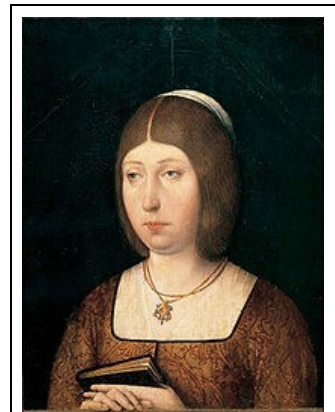
Isabella I 1451-1504