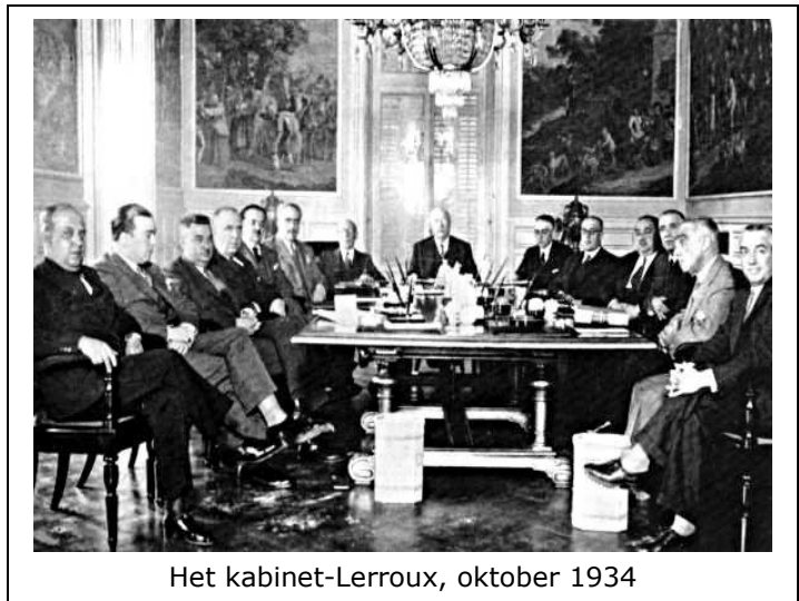
Het kabinet-Lerroux, oktober 1934

De repressie die volgde op het neerslaan van de opstand was hard en er werden contraproductieve maatregelen getroffen zoals die tegen Catalonië, het onnodig lang handhaven van de staat van beleg en de censuur, maar vergeleken met de duizenden executies die volgden op de omverwerping van de commune van Parijs in 1871 was het gedrag van de centrumrechtse regering niet buitensporig te noemen. Het lijkt overigens geen twijfel dat deze regering in haar streven om hervormingen terug te draaien die onder de linkse regering in de periode 1931-1933 waren geïnitieerd, er mede oorzaak van is geweest dat in oktober van 1934 de revolutie was uitgebroken.