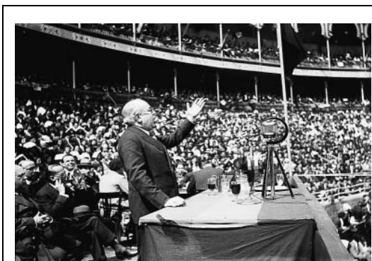
Azaña tijdens een meeting in 1935

Uiteindelijk kreeg Chapaprieta de opdracht een regering te formeren. Een opdracht waarin hij slaagde, maar wat leidde tot een kabinet dat qua politieke samenstelling in feite dezelfde was als de vorige coalitie. Wel waren bezuinigingen ingebouwd door ministeries samen te voegen. Het aantal ministers werd gereduceerd van dertien naar negen. Lerroux werd minister van Buitenlandse Zaken. Het aantreden van deze nieuwe regering was voor de monarchistische leider Calvo Sotelo aanleiding om de president de mantel uit te vegen, erop wijzend dat sinds het ontstaan van de republiek er veertien kabinetten waren aangetreden en zeventig ministers. Hij verweet Alcalá Zamora zich direct te hebben bemoeid met de keuze van bewindslieden, wat hem volgens de grondwet niet zou zijn toegestaan.