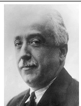
Niceto Alcalá Zamora 1880-1949