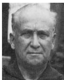
Francisco Largo Caballero 1869-1946

Begin 1936, aan de vooravond van de verkiezingen die op 16 februari gehouden zouden worden, was het politieke landschap in Spanje ruwweg verdeeld in drie blokken: het linkse Volksfront (waaronder de