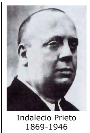
Indalecio Prieto 1869-1946

Het politieke programma van het Volksfront was uiteraard een moeizaam compromis waarin de erkenning van de grondwet een heet hangijzer was omdat revolutionair links zich tot dan toe niet gebonden had getoond aan dit gezag. Om de revolutionairen tegemoet te komen waren er bepalingen opgenomen die voorzagen in een algemene amnestie voor gepleegde revolutionaire gewelddaden (waaronder moordpartijen), terwijl dit niet gold voor degenen die beschuldigd waren van acties om deze wandaden te onderdrukken. De passages over de landhervorming hielden een compromis in waarbij links concessies had moeten doen. De gematigd republikeinen accepteerden niet dat land zomaar onteigend zou kunnen worden om gratis ter beschikking te stellen aan boeren en dus werd een voorstel geformuleerd dat voorzag in meer steun aan de landbouw, een progressievere pachtwet en het stimuleren van vormen van collectieve productie. Het was uiteindelijk een wankel programma dat meer paste bij de republikeinen dan bij hun linkse gesprekspartners, maar niettemin was het Volksfront daarmee een feit. Tot tevredenheid van Azaña, die de vorming van het Volksfront als een middel zag om zelf weer aan de macht te komen en niet als doel op zich.