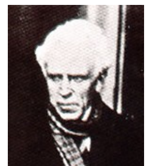
Manuel Portela 1868 - 1952

In de avond van 16 februari begonnen de meest linkse aanhangers van het Volksfront zich te roeren. Zij achtten de tijd rijp voor een echte revolutionaire omwenteling die een einde zou maken aan het burgerlijk bewind. Manifestaties werden vergezeld van brandstichting in kerken en andere religieuze gebouwen, ongeregelde heden die zich de volgende dag voortzetten en hoewel geenszins duidelijk was of de plaatselijke autoriteiten de situatie aankonden, was dit voor Gil-Robles, leider van de CEDA, reden om de noodklok te luiden. Telefonisch verzocht hij premier Portela de staat van beleg af te kondigen. Ook de chef van de generale staf, generaal Franco, maakte zich ongerust en probeerde op de avond van 18 februari Portela te bewegen in te grijpen, maar deze gaf als antwoord dat hij 'zijn kussen zou raadplegen'. Portela, die tegen de zeventig liep, had er genoeg van en adviseerde president Alcalá Zamora de volgende dag om de macht over te dragen aan Azaña zonder de definitieve uitslag van de verkiezingen af te wachten. De weg lag open voor links dat echter niet in staat bleek om het toenemend geweld te stoppen en de Burgeroorlog te voorkomen.