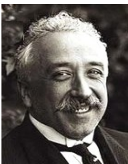
Niceto Alcalá Zamora 1880-1949

De politieke crisis die zich voordeed in Spanje eind 1935, was voor president Alcalá Zamora aanleiding opdracht te geven aan de monarchist Manuel Portela om een minderheidskabinet te formeren en aan te sturen op nieuwe verkiezingen. Het werd een kabinet van links-republikeinen, politiek onafhankelijken en militairen onder leiding van premier Portela, dat op 14 december werd geïnstalleerd. Een vreemde beslissing van de president, want de