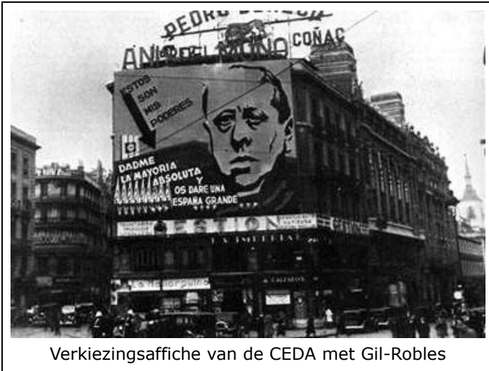
Verkiezingsaffiche van de CEDA met Gil-Robles