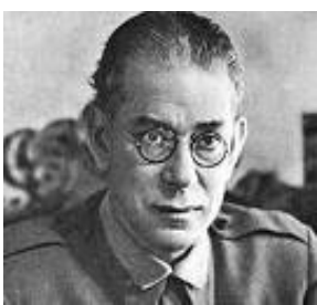
Emilio Mola Vidal 1887- 1937