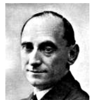
Santiago Casares Quiroga 1884-1950