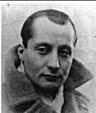
José Primo de Rivera 1903 - 1936

Het aantreden van de nieuwe regering had in eerste instantie een matigend effect op het geweld, maar half maart nam dit weer in alle hevigheid toe en dat zou zo blijven tot aan het begin van de militaire opstand op 19 juli. Het ergst ging het eraan toe in Granada waar het civiele bestuur besloot om groepen van revolutionairen toe te staan op te treden als ondersteunende politiefunctionarissen. Deze lichtzinnige maatregel werd al snel ook in andere gebieden gevolgd, wat de wetteloosheid alleen maar deed toenemen.