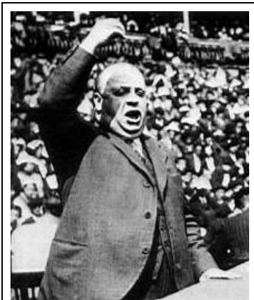
Indalecio Prieto 1869-1946

Om een eind te maken aan de wanorde in Spanje zou het beter zijn geweest wanneer er een kabinet was geformeerd met een breder draagvlak, met name met de steun van de socialisten van de Partido Socialista Obrero Español (PSOE). Maar die partij was hopeloos verdeeld in een revolutionaire vleugel onder aanvoering van Francisco Largo Caballero en een gematigde, waarvan Indalecio Prieto de voorman was. Largo Caballero was uit op het veroveren van de macht via linkse samenwerking met communisten en links-republikeinen, maar daarvoor bestond onvoldoende draagvlak. Het enige alternatief voor de PSOE was samenwerking te zoeken met de partij van Azaña en een gematigde koers te varen, maar dat zou de partij doen splijten. En zo modderde het minderheidskabinet door. De revolutionairen wachtten op hun kans de macht te veroveren zoals La Pasionaria had bepleit en het leger maakte zich op om in te grijpen.