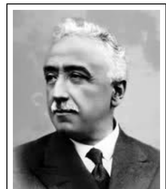
Niceto Alcalá Zamora 1880-1949

Begin april was het zover en werd Alcalá Zamora weggestemd via een uiterst merkwaardige procedure. In de grondwet was vastgelegd dat een president de bevoegdheid had om twee keer tijdens zijn ambtsperiode het parlement te ontbinden, maar dat het parlement na de tweede keer zelf mocht onderzoeken of dat op legitieme wijze was gebeurd. Wanneer zij tot de conclusie zou komen dat de ontbinding illegitiem was, dan kon het parlement de president onmiddellijk wegstemmen.