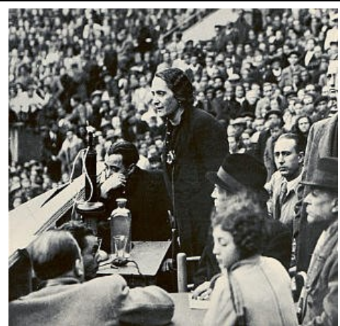
Dolores Ibárruri 1895 - 1989

Hoewel Azaña zeker verantwoordelijkheid droeg voor de toename van het geweld, was hij geschokt door de toenemende anarchie in het land hekelde hij de incompetentie van de politie en lokale bestuurders. Maar hij zal zich ervan bewust zijn geweest dat hij op dat moment de tol betaalde aan uiterst links vanwege samenwerking in het Volksfront, waarvan niet alle partijen zijn trouw aan het grondwettelijk gezag deelden. Zo verklaarde de communistische voorvechter Dolores Ibárruri - bekend als La Pasionaria - op 1 maart: 'Wij bevinden ons in een revolutionaire situatie die niet kan worden opgehouden door wettelijke belemmeringen [... .] Het volk stelt zijn eigen wetten en op 16 februari vroeg het om executie van zijn moordenaars. De Republiek moet tegemoet komen aan de wensen van het volk. Wanneer zij dat nalaat zal het volk haar omverwerpen en zijn eigen wil opleggen.'