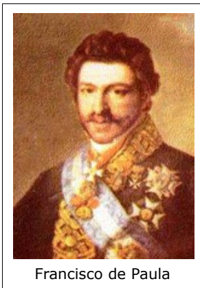
Francisco de Paula

De twee jongste kinderen, Maria Isabella en Frans Anton waren haar oogappels, maar de relatie met haar oudste zoon, kroonprins Ferdinand, was gespannen en later zelfs openlijk vijandig. Voor alle kinderen werden huwelijkspartners gevonden in de toonaangevende kringen van Europa. Maria Amalia huwde haar oom, zodat haar schoonouders tevens haar grootouders waren: Karel III en Maria Amalia van Saksen. Karel Maria werd Carlistisch troonpretendent na de dood van zijn oudere broer, Ferdinand VII, toen diens dochter Isabella II - doordat haar vader de Salische wet had afgeschaft - op de troon kwam en Karel Maria die regeling betwistte. Maria Isabella werd later de moeder van Ferdinand II. Frans Anton erfde de titel Francisco de Paula van Bourbon en zijn schoonouders waren Maria Isabella en Frans I der beide Siciliën.