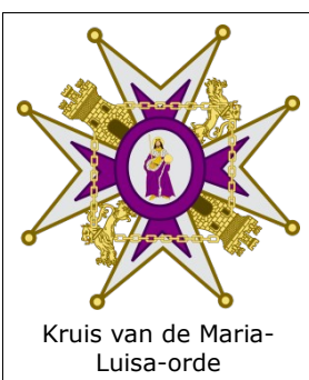
Kruis van de Maria-Luisa-orde

Na lang aandringen van de zijde van Maria Louisa stichtte haar gemaal in 1792 in navolging van andere Europese hoven, een damesorde, de Maria-Luisa-orde, bedoeld om adellijke dames te eren om hun diensten of kwaliteiten en aan het hof te binden. De koningin verrichtte de benoemingen en leidde de orde. De leden ontvangen een gouden kruis met een afbeelding van koning Ferdinand III (1199-1252) van Castilië die om zijn veroveringen op de Moren en zijn schenkingen aan de rooms-katholieke kerk al tijdens zijn leven De Heilige werd genoemd, al werd hij pas in 1671 gecanoniseerd. Als verplichting voor de maximaal dertig dames van de orde geldt het verrichten van charitas en het bijwonen van religieuze plechtigheden. In de loop der jaren ontvingen 1193 dames de eervolle benoeming tot lid van de orde. De meest recente benoemingen dateren van 2008.