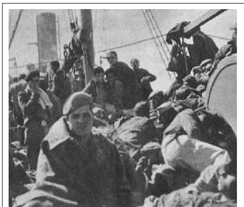
Nationalisten op de Castillo de Olite