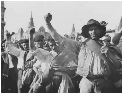
Vluchtelingen uit Aragón in Barcelona

Voor de aankoop van wapens was de republiek geheel afhankelijk van het buitenland en diende zij alle transacties te betalen in contanten of met goud of andere kostbaarheden. Al in 1936 werd de Spaanse goudvoorraad ingezet voor aankopen in de Sovjet-Unie en Frankrijk. Voor het uitbreken van de Burgeroorlog was Spanje gewoon om militair materieel van de Duitsers te kopen en dat ging door terwijl de Nazi's al samenwerkten met Franco.