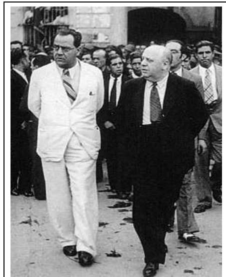
Juan Negrín (l) en Indalecio Prieto

Net als Prieto was president Manuel Azaña er op dat moment vrijwel van overtuigd dat de oorlog verloren was en de regering beter kon capituleren, maar Negrín wist hem ertoe te bewegen door te zetten. Negrín formeerde een nieuw kabinet dat op 6 april 1938 aantrad en waarin hij behalve premier ook minister van Defensie werd. Dit kabinet - het zogenaamde oorlogskabinet - zou aanblijven tot vlak voor de capitulatie op 29 maart 1939. Maar Prieto en Azaña kregen gelijk. Na de nederlaag die de republikeinen leden bij Teruel in de winter van 1937-1938, rolden de nationalistien het front van Aragón op en waren de republikeinen niet in staat om te voorkomen dat Franco's troepen de kust bereikten en de republikeinse zone in tweeën werd gedeeld.