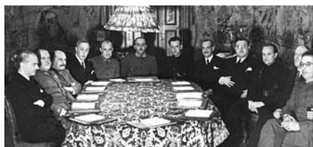
Eerste kabinet Franco. Geheel links Serrano Suñer

Op 18 juli, vlak voordat de republikeinen het Ebro-offensief zouden inzetten, werd Franco ter gelegenheid van de tweede verjaardag van de opstand door zijn kabinet in Burgos benoemd tot Capitán General (deze staat boven de generaals en admiraals) van het leger, de meest eervolle titel in Spanje, die tot dan toe uitsluitend werd toegekend aan koningen.