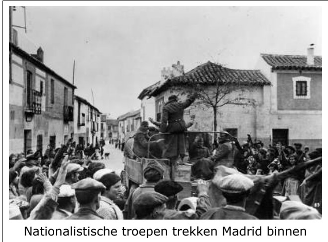
Nationalistische troepen trekken Madrid binnen

Hij nam met niets anders genoeg dan de overdracht van de republikeinse luchtmacht en het hijsen van de witte vlag door het leger. Maar het weer liet de overdracht de luchtmacht niet toe, communicatie met de nationalististen over dit probleem mislukte en Franco gaf het bevel tot het eindoffensief, een offensief dat nauwelijks of geen weerstand ondervond. Op 28 maart marcheerden Franco's troepen Madrid binnen. De Nationale Defensieraad viel uiteen, Casado vertrok naar Valencia en de volgende dag volgde de formele overgave van de republikeinen. Duizenden burgers en militairen trachtten op het laatste moment weg te komen via de havens van Valencia, Alicante en Cartagena, maar voor velen was het te laat. Zij werden afgevoerd door de nationalististen naar concentratiekampen, gevangenis en arena's en er was sprake van zelfmoord op grote schaal. Casado wist te ontkomen aan boord van een Engelse kruiser. Besteiro besloot in Madrid te blijven. Hij werd veroordeeld tot dertig jaar gevangenisstraf, maar overleed al in 1940 ten gevolge van afschuwelijke omstandigheden in de gevangenis.