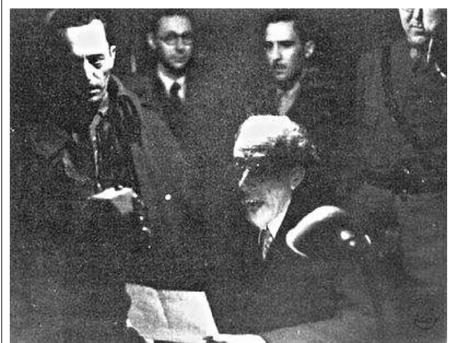
Besteiro (1870-1940) maakt de machtsovername bekend in de nacht van 6 maart 1939

Vlak na het uitbreken van de opstand in Cartagena formeerde Casado op 5 maart een Nationale Defensieraad. Hijzelf werd president en nam Defensie onder zijn hoede, Besteiro werd raadsadviseur en verder werd de raad bemand door links-republikeinen, gematigd socialist en anarchisten. De raad wist zich gesteund door luitenant-kolonel Cipriano Mera, een man met anarchistische sympathieën, die zich niet kon vinden in het beleid van Negrín en een deel van de militairen waarover hij het bevel voerde had overgebracht naar Madrid. Middernacht van 6 op 7 maart maakte Besteiro via de radio bekend dat de militairen de macht in het republikeinse zone hadden overgenomen en beschuldigde Negrín ervan het volk te bewegen tot voortzetting van het verzet tegen Franco, terwijl hijzelf en zijn aanhangers bezig waren een veilige vlucht voor te bereiden. Als reden voor de opstand werd aangegeven dat de militairen daarmee een coup van de communisten wilden voorkomen. Negrín, die het nieuws hoorde tijdens zijn late diner, was woedend en ontsloeg Casado telefonisch, maar hij wist dat zijn positie hopeloos was. Diezelfde dag nog vertrok Negrín per vliegtuig naar Toulouse. Hij werd daarbij vergezeld door onder anderen Dolores Ibárruri (La Pasionaria) en zijn partijgenoot Álvarez del Vayo.