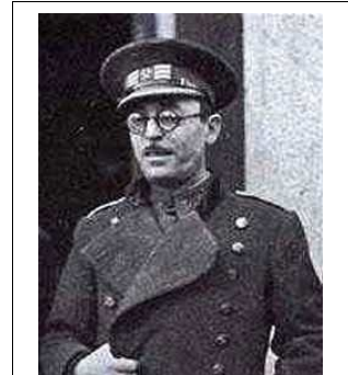
Segismundo Casado 1893-1968