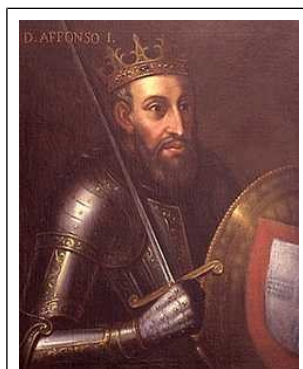
Alfons I van Portugal 1109-1185

Alfons VII trad in 1128 in het huwelijk met Berenguela, de dochter van de graaf van Barcelona. Uit dit huwelijk werden zeven kinderen geboren, waarvan er vier vooraanstaande rollen zouden gaan spelen. Hun zonen Sancho en Ferdinand zouden later koning worden van respectievelijk Castilië en León, waardoor beide rijken weer langdurig van elkaar zouden worden gescheiden. De oudste dochter Sancha huwde Sancho VI, koning van Navarra en de tweede dochter Constance trouwde met Louis VII, koning van Frankrijk.