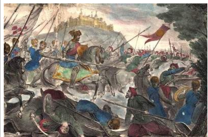
Alfons I van Portugal bij Badajoz in 1169

Ook in het westen van zijn rijk ondervond Ferdinand II problemen toen tussen 1166 en 1168 zijn schoonvader, koning Alfons I van Portugal zich meester maakte van een aantal gebieden die aan de kroon van León behoorden. Aanleiding was de restauratie van Ciudad Rodrigo. De Portugese koning verdacht Ferdinand II ervan deze stad, zo dichtbij de grens met Portugal, te willen versterken om van daaruit een aanval op Portugal te doen. Alfons I van Portugal drong Galicië binnen, veroverde diverse steden om vervolgens in het zuiden Leonese steden aan te