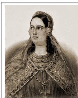
Teresa van León ca. 1083-1130

Vlak daarop drong Alfons VII het graafschap Portugal binnen dat geregeerd werd door zijn tante, Teresa van León. Zij was een onwettig kind van Alfons VI, de grootvader van Alfons VII. In 1095 huwde zij Hendrik van Bourgondië, ter gelegenheid waarvan het echtpaar het graafschap Portugal ontving uit handen van Alfons VI. Na de dood van Hendrik in 1112 regeerde Teresa over dit gebied als koningin van Portugal en kwam later in conflict met haar neef, Alfons VII. Haar alliantie met een Galicische graaf bracht haar tevens in conflict met de edelen van Portugal die een Galicische overheersing vreesden. De zoon van Teresa, Alfons van Portugal, nam het op voor de belangen van de Portugese edelen en vocht met succes een slag uit tegen de troepen van zijn moeder. Teresa vluchtte en Alfons nam het bestuur van het Portugese graafschap over. Nadat hij in 1139 een grote overwinning had behaald op de Almoraviden, werd hij uitgeroepen tot koning van Portugal. In 1143 sloot de Portugese koning een vredesovereenkomst met Alfons VII, het verdrag van Zamora, waarmee de zelfstandigheid van Portugal definitief bezegeld werd.