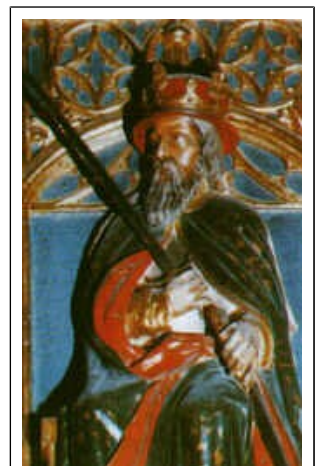
Ferdinand II van León 1137-1188