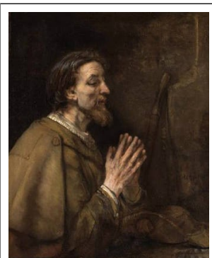
De heilige Jacobus door Rembrandt

Tussen 1164 en 1177 kende Ferdinand II een groot aantal steden privileges toe. Ook stichtte hij de Orde van Santiago, vernoemd naar de heilige Jacobus van Santiago, beschermheer van Spanje, ook bekend als Jacobus de Morendoder, die volgens de legende meermalen meestreed tijdens veldslagen tussen christenen en Moren. Deze militaire en religieuze orde had ten doel de strijd tegen de Moren te bevorderen en de pelgrims naar Santiago te beschermen. Paus Alexander III verleende de stad Santiago de Compostela de gunst het heilige jubileum van Jacobus te mogen vieren in 1181, een gebaar waardoor het aantal pelgrimstochten naar de stad zeer bevorderd werd, hetgeen een gunstig effect had op de economische en culturele ontwikkeling van de streken waar de uit de tiende eeuw daterende Camino de Santiago doorheen liep.