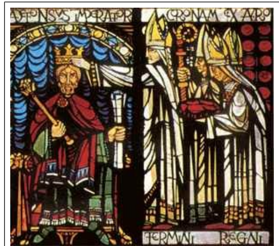
Kroning van Alfons VII tot keizer in 1135

In 1136 sloot Alfons VII een overeenkomst met Navarra dat hij de zeggenschap over Zaragoza gunde. Met Ramiro II van Aragón sloot hij eveneens een pact en regelde hij het huwelijk van zijn oudste zoon Sancho met Petronila, de dochter van de Aragonese koning. Dit huwelijk ging op het laatste nippertje niet door. De Aragonese edelen vonden dat dit te ver ging en besloten tot een huwelijk van Petronila met Ramón Berenguer IV, de graaf van Barcelona. Dit alles had overigens een stabiliserend effect in de christelijke rijken en gaf Alfons VII volop de gelegenheid zich te richten op de verovering van Moors grondgebied. De steden Coria, Jaén en Córdoba vielen in de jaren 1142-1144 in handen van de Leonees, zij het dat de hoofdstad van het oude kalifaat van Córdoba direct erna weer door de Moren werd heroverd.