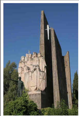
Monument voor de slag bij Navas de Tolosa La Carolina, Jaén

Nadat de plooiën tussen León en Castilië leken te zijn gladgestreken, besloot de Castiliaanse koning af te rekenen met zijn zuiderburen, de Almohaden die een voortdurende bedreiging vormden. Hij riep de hulp in van León, maar Alfons IX weigerde deze te geven vanwege het feit dat zijn neef geen aanstalten maakte om bezittingen terug te geven aan León waartoe hij zich verplicht had. Het liep slecht af voor de Castilianen. In de slag bij Alarcos, juli 1195, nabij Ciudad Real, leden de christelijke legers een grote nederlaag. De Moorse bedreiging bleef realiteit. Dit bracht enkele jaren later paus Innocentius III ertoe om de koning van Castilië op