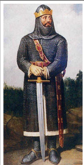
Alfons VII van León 1105-1157

In 1134 overleed Alfons I van Aragón. Hij had geen nakomelingen en liet zijn bezittingen na aan een drietal militaire ordes, een testament dat door de edelen van Aragón niet werd geaccepteerd. En ook Alfons VII ging hiermee niet akkoord. Net als de overledene was hij een achterkleinzoon van Sancho de Grote van Pamplona en vanwege deze verwantschap meende hij aanspraak te kunnen maken op althans delen van de nalatenschap. De edelen van Aragón beslisten echter anders. Aragón werd gesplitst in de zelfstandige rijken Navarra en Aragón. Navarra kwam in handen van García Ramírez, een neef van Alfons VII, die zich goed wist te verdedigen tegen de Leonese aanvallen. Aragón kwam onder bewind van de zwakke Ramiro II de Monnik, die meer belangstelling had voor religieuze zaken dan voor veldtochten. Alfons VII, die geen genoegen nam met de gang van zaken, viel het Aragón van Ramiro II binnen en nam bezit over de stad Zaragoza, die in 1118 door de Aragonezen veroverd was op de Moren.