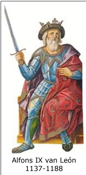
Alfons IX van León 1137-1188

Zoals gebruikelijk behoorden daar de belangrijke geestelijken toe, waaronder de bisschop van Santiago de Compostela en de hoge adel en ook waren bestuurders van de grote steden aanwezig. De steden waren rijk in die tijd en het koninkrijk arm. Alfons IX vroeg en kreeg financiële hulp voor de noodzakelijk geachte oorlogvoering. In ruil hiervoor beloofde hij zijn rijk bestuurlijk op orde te brengen en machtsmisbruik van edelen tegen te gaan. Bijzonder was dat voor deze Cortes ook vertegenwoordigers van het volk waren uitgenodigd; historisch gezien een novum.