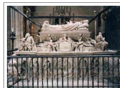
Graftombe van Johanna van Castilië en Filips van Bourgondië, door Bartolomé Ordóñez, Capilla Real, Granada

Johanna's jongste dochter, Catharina, verbleef van jongs af aan altijd bij haar moeder in Tordesillas en verliet haar pas in 1525, toen ze achttien jaar oud was, voor haar huwelijk met Johan III van Portugal. Dit huwelijk was door haar oudste broer gearrangeerd als een soort genoegdoening voor haar verloren jeugd.