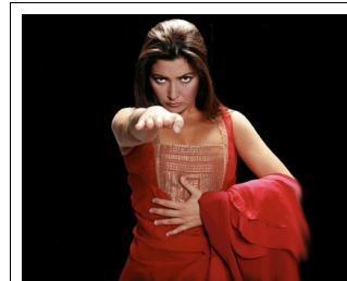
Sara Baras: Juana la Loca

Ook beoefenaars van verschillende kunstvormen waren gefascinerend door het leven van Johanna. Filmregisseur Vicente Aranda legde in zijn interpretatie, de film Juana la Loca uit 2001, het accent op de felle hartstocht, de buitenzinnige liefde voor de ontrouwe echtgenoot en de wanhopige jaloezie van Johanna. Pilar López de Ayala ontving voor haar rol in deze film de Goya voor beste actrice van dat jaar. De beroemde flamencodanseres Sara Baras ontwikkelde in 2005 een in-