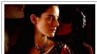
Pilar López de Ayala als Juana la Loca

Ook beoefenaars van verschillende kunstvormen waren gefascinerend door het leven van Johanna. Filmregisseur Vicente Aranda legde in zijn interpretatie, de film Juana la Loca uit 2001, het accent op de felle hartstocht, de buitenzinnige liefde voor de ontrouwe echtgenoot en de wanhopige jaloezie van Johanna. Pilar López de Ayala ontving voor haar rol in deze film de Goya voor beste actrice van dat jaar. De beroemde flamencodanseres Sara Baras ontwikkelde in 2005 een in-