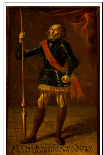
Fernan González de Goede Graaf c. 910-970

Fernán González overleed in 970 en werd opgevolgd door zijn zoon García Fernández, die veel te stellen kreeg met de Moorse aceifas van Almanzor. Delen van het graafschap vielen weer in Moorse handen. Vanaf 992 had Almanzor een bondgenoot in de opstandige zoon van García Fernández, Sancho García. In 995 werd García Fernández door Almanzor verslagen, gevangen genomen en vermoedelijk niet lang daarna gedood. Met toestemming van de Moorse vorst nam Sancho García het graafschap over van zijn vader.