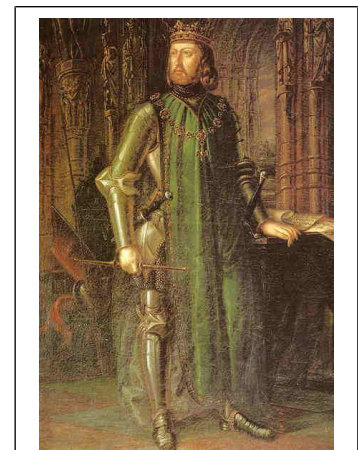
Johan I 1358-1390

Het gezagsvacuüm na de dood van Johan I ontstond omdat zijn dood enige tijd geheim werd gehouden om de troonsopvolging door Hendrik III te regelen. Effectief werd diens koningschap pas in 1393, toen hij dertien jaar oud was. Hendrik had een zwakke gezondheid en werd gekweld door tyfus en pokken, vandaar zijn bijnaam 'De Ziekelijke'. Zijn broer Ferdinand heeft tot vlak voor de dood van Hendrik III de illusie gehad hem te kunnen opvolgen omdat niemand erop rekende dat Hendrik een mannelijke nakomeling zou voortbrengen, maar deze hoop vervloog toen zijn vrouw Catharina Hendrik in 1405 een zoon schonk.