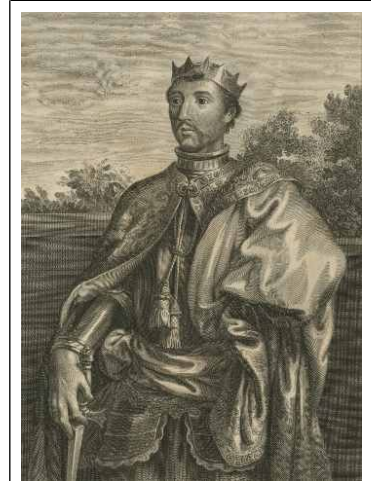
Peter I van Castilië 1334-1369

Het eerste gewelddadige optreden kwam van de kant van Maria van Portugal die Eleonora de Guzmán liet vermoorden. Peter I verstevigde zijn positie door in 1353 een opstand in Asturië van zijn halfbroers Hendrik en Tello te onderdrukken. In datzelfde jaar trad Peter I in het huwelijk met Blanca van Bourbon, afgedwongen door Maria van Portugal, koning Johan II van Frankrijk en paus Innocentius IV. Allen achtten het van belang dat er een verbintenis tussen Castilië en het Franse koningshuis tot stand kwam. Peter I had op dat moment een relatie met Maria de Padilla, bij wie hij reeds een dochter had verwekt. Ook wist hij dat Blanca net als hij onder druk gezet was om het huwelijk met hem aan te gaan. Niettemin ging Peter I akkoord met deze verbintenis, waarmee een aanzienlijke bruidsschat was gemoeid. De Franse koning had zich verplicht tot het betalen van 300.000 florijnen, maar hield zich niet aan de afspraak om in eerste termijn een deel ervan te voldoen. Peter voelde zich bedrogen, verliet Blanca al na enkele dagen en liet haar opsluiten.