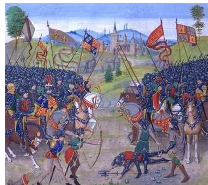
Slag bij Nájera, 1367

Hendrik formeerde in Frankrijk een groot leger van huurlingen waarmee hij Castilië binnenviel in 1366. In Calahorra, nabij Logroño, dat zich zonder slag of stoot overgaf, werd hij door de zijnen uitgeroepen tot koning van Castilië en León. Met uitzondering van Galicië en Sevilla erkende heel Castilië binnen een maand Hendrik als koning. Peter I vluchtte via Galicië naar Frankrijk en riep de hulp in van de Zwarte Prins. In 1367 versloeg hij zijn tegenstander in de tweede slag bij Nájera en wist hij zijn heerschappij te herstellen.