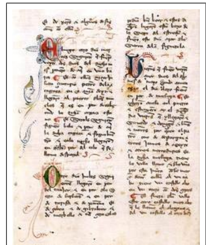
Pagina uit de Embajada a Tamorlán

Gedurende de tweede helft van de veertiende eeuw voltrokken zich in Castilië grote veranderingen op sociaal-economisch en staatsrechtelijk terrein. Nadat de pest was uitgewoed en het aantal handarbeiders sterk was teruggelopen, leidden technische vindingen, met name in de landbouw, tot een verhoging van de productie en tot economische voorspoed. Ook de bevolking groeide sterk, vooral in de steden, die een steeds belangrijker plaats gingen innemen in het koninkrijk. Het werden grote centra van nijverheid en handel en de jaarmarkten, de ferias , speelden niet alleen een nationale, maar ook internationale rol. Bekendste jaarmarkten waren die van Burgos, Toledo en Medina del Campo. In Medina is een museum ingericht over de historie van de ferias .