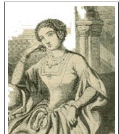
Maria de Padilla 1334-1361

Samen met Johan Alfons van Alburquerque, Peters eerdere vertrouweling en gouverneur, beraamde de broer van Johanna van Castro, Fernán Ruiz in 1354 uit wraak een nieuwe opstand tegen de koning. Het was het voorspel tot een complete burgeroorlog. De opstandelingen kregen daarbij brede steun uit de aanhang van koningin Blanca. Een aanhang die vooral uit hoge edelen bestond. De koning kon in dit conflict rekenen op steun van de lagere adel waartoe zijn geliefde Maria de Padilla behoorde, van de stedelijke bourgeoisie en de joodse gemeenschap. Nadat Johan Alfons van Alburquerque, die optrad als leider, overleden was - naar men zegt vergiftigd op instigatie van de koning - zagen de samen-zweerdere verder af van hun plannen.