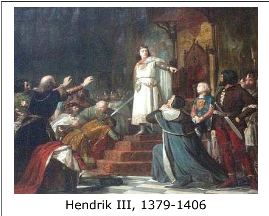
Hendrik III, 1379-1406

Ondanks het feit dat Hendrik III nog erg jong was toen hij aan de macht kwam en te lijden had van een zwakke gezondheid, heeft hij een belangrijke bijdrage geleverd aan de bestendiging van de Castiliaanse kroon. Net als zijn overgrootvader Peter I stelde hij paal en perk aan de macht van de traditionele adel en verbeterde hij de positie van de nieuwe elite, de stedelijke