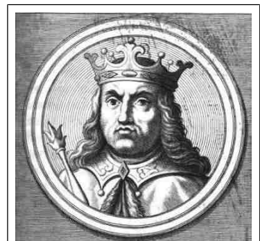
Hendrik II van Trastámara 1334-1379

Met Ferdinand I van Portugal vocht Hendrik II om de troon van Castilië in de zogenaamde Guerras Fernandinas . De eerste oorlog eindigde in 1370 na een veldslag bij Lugo in het voordeel van Hendrik II, maar een paar jaar erna brak er een nieuw conflict uit toen Jan van Gent een geheime afspraak maakte met Ferdinand van Portugal om Hendrik van de troon te stoten. Hun poging mislukte en Hendrik II drong in 1373 Portugal binnen en dwong een vredesverdrag af: het pact van Santarem. Deze overeenkomst bezegelde het lot van Hendriks tegenstanders. Hendrik dwong de Portugese koning voormalige aanhangers van de door hem vermoorde Peter I te verbannen en verplichtte hem tevens tot het geven van zijn toestemming tot een aantal huwelijken die de beide families stevig zouden verbinden.