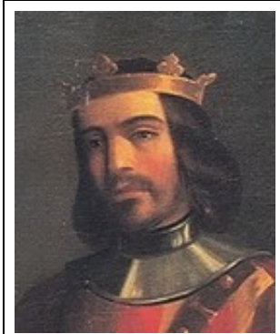
Ferdinand I van Aragón 1380-1416

Hendrik III regeerde over Castilië vanaf 1390 en was sinds 1388 gehuwd met Catharina van Lancaster, een dochter van Jan van Gent. Uit dit huwelijk waren al twee dochters geboren en toen de koningin in 1404 opnieuw zwanger raakte steeg de spanning aan het Castiliaanse hof. Met name de koning zelf, die altijd een zwakke gezondheid had gehad - hij werd de Ziekelijke genoemd - maakte zich zorgen. Omdat hij vreesde elk moment te kunnen overlijden, had hij zijn broer Ferdinand als zijn opvolger aangewezen, maar de komst van een mannelijke nakomeling zou bij zijn vroegtijdig overlijden voor allerlei opvolgingsproblemen kunnen zorgen. Zijn vrees werd bewaarheid toen hij tijdens de kerstdagen van 1406 in Toledo overleed. Het testament liet echter geen ruimte voor misverstanden. Johan II, nog geen twee jaar oud, was wettelijke troonopvolger, en de primaire verantwoordelijkheid als regent was gelegd bij prins Ferdinand. Weliswaar gingen er stemmen op om Ferdinand als koning te benoemen, maar deze hield zich nauwgezet aan de wensen van zijn overleden broer en stond erop dat zijn neefje werd uitgeroepen tot koning van Castilië.