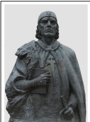
Álvaro de Luna 1390-1453

Toen in 1418 Catharina van Lancaster overleed waren het de bisschoppen van Toledo en Sigüenza die het regentschap over de twaalfjarige Johan II in handen namen. Zij besloten dat de koning in het huwelijk zou treden met zijn nicht Maria, oudste dochter van Ferdinand I, en dat prins Hendrik van Aragón zou trouwen met Johans jongere zuster Catharina van Castilië. Deze Hendrik, gegriefd door het feit dat zijn oudere broers wel uitzicht hadden op een koningschap en hij niet, trachtte in 1420 een greep naar de macht te doen door de Castiliaanse koning te ontvoeren en gevangen te nemen: de zogenoemde Golpe de Tordesillas . Terwijl Hendrik in feite de macht over Castilië had overgenomen, werden beide door de bisschoppen gearrangeerde huwelijken nog in datzelfde jaar voltrokken.