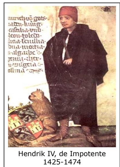
Hendrik IV, de Impotente 1425-1474

Hendrik IV begon zijn bewind ambitieus met uitvoering van een aantal plannen om rust en orde te brengen. Eerste was versterking van de economische positie van Castilië door verhoging van belastingen en versteviging van het toezicht op de inning ervan. Daarnaast had de verzoening tussen het koningshuis en de aristocratie een hoge prioriteit, cruciaal om het rijk te kunnen besturen. Ook de relatie met de Cortes kreeg de aandacht van de koning die erop uit was zich te omringen met edelen - vooral uit de wat lagere standen - die hem door dik en dun steunden. In aanvulling daarop trachtte hij meer draagvlak te creëren voor zijn plannen door stedelijke bestuurders aan zich te binden. Vredes- en vriendschapsbanden aanhalen met christelijke buurlanden als Frankrijk en Portugal was eveneens een van zijn wensen, vooral met het oog op het bewerkstelligen van tegenwicht tegen het altijd opdringerige Aragón. Laatste en niet de geringste doelstelling was intensivering van de campagnes tegen het Moorse rijk Granada, een voornemen dat de koning het meest na aan het hart lag.