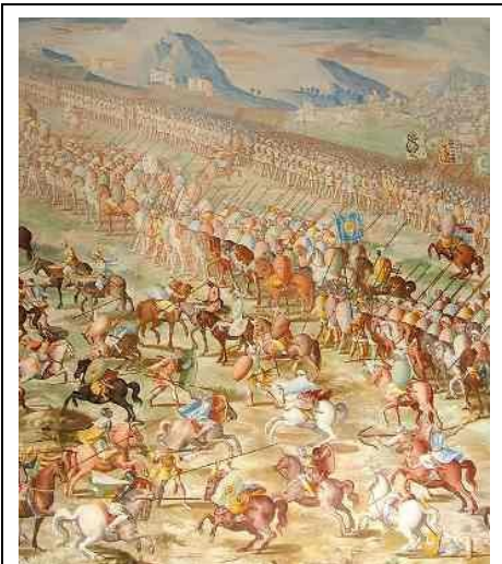
De Slag van La Higuera

In 1429 kwam het bijna tot een oorlog tussen Castilië en Aragón, maar dankzij bemiddeling van de gezamenlijke edelen uit de beide rijken werd een overeenkomst gesloten - las Treguas de Majano - die erin voorzag dat de Aragonese prinsen zich zouden terugtrekken uit Castilië en hun bezittingen aldaar overdroegen aan koning Johan II. Het bracht rust in Castilië waar Álvaro de Luna oppermachtig was en een aantal bestuurlijke maatregelen trof om niet alleen de economische positie van het land te verstevigen, maar ook een financiële basis te creëren voor militaire campagnes tegen de Moren. Deze campagnes, die zich afspeelden tussen 1431 en 1436 genoten brede steun onder de edelen die inzagen dat uitgaven ten bate van de strijd tegen de Moren en die leidden tot gebiedsuitbreiding van Castilië, uiteindelijk voor hen meer profijtelijk zouden zijn dan energie en middelen te steken in onderlinge twisten. De eerste campagne bracht direct een enorm succes. Onder aanvoering van Álvaro de Luna werden de legers van het Moorse koninkrijk Granada een nederlaag toegebracht in de slag van La Higuera.