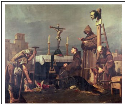
De onthoofding van Álvaro de Luna

Het was ook in 1451 dat het eerste kind van Johan II en zijn tweede echtgenote het licht zag: prinses Isabella, de latere koningin Isabella II ( la Católica ) van Castilië. Twee jaar daarna gaf Johan II toe aan de druk op hem om Álvaro de Luna te laten vallen en gaf hij opdracht zijn vertrouweling te arresteren. Begin juni 1453 onderging Álvaro de Luna eenzelfde lot als hij vele anderen had toebedacht: hij werd onthoofd in het openbaar op de Plaza Mayor van Valladolid.