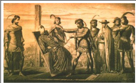
De klucht van Ávila

Hendrik, politiek verzwakt, erkende in 1465 zijn halfbroer Alfons als zijn opvolger en stemde in met de benoeming van een commissie bestaande uit leden van beide partijen, die voorstellen ter reorganisatie van het rijk zou doen. Het resultaat ervan werd vastgelegd in de zogenaamde Sentencia de Medina del Campo die voor Hendrik IV echter onacceptabel was. Hij besloot de rebellen te bestrijden, zocht steun bij koning Alfons V van Portugal en startte onderhandelingen met deze vorst over een mogelijkheid hem te laten trouwen met zijn halfzuster Isabella, die daar gezien het leeftijdsverschil van twintig jaar overigens niets voor voelde.