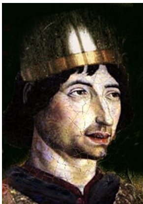
Johan II van Castilië 1405-1454

Tijdens de minderjarigheid van Johan II groeide de machtspositie van zijn oom en regent aanzienlijk toen Ferdinand in 1412 gekroond werd tot koning van Aragón. Zijn voorganger, Martin I, was overleden zonder een legitieme opvolger na te laten en er dienden zich wel zeven troonpretendenten aan, waaronder prins Ferdinand die een kleinzoon was van de vroegere koning van Aragón, Alfons IV. Na langdurige beraadslagingen door vertegenwoordigers van Aragón, Catalonië en Valencia viel de keuze op Ferdinand. Om zijn economische macht - Ferdinand bezat veel grondgebied - maar vooral vanwege zijn talenten als veldheer die hij bewezen had met zijn verovering van Antequera op de Moren in 1410, gaf men aan hem de voorkeur boven de andere pretendentes. Deze benoeming tot koning van Aragón werd vastgelegd in het Compromiso de Caspe en hield dus in dat een lid van het Castiliaanse koningshuis van Trastámara de Aragonese troon besteeg.