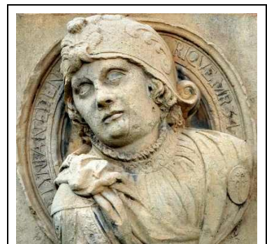
Hendrik van Aragón 1400-1445

Tot 1450 was Álvaro de Luna oppermachtig, maar het was Johan Pacheco, eerste markies van Villena en een gunsteling van kroonprins Hendrik, die de positie van Álvaro begon te ondergraven. De heerser over Castilië, die steeds impopulairder werd, overspeelde zijn hand door in 1447 Johan II te dwingen tot een tweede huwelijk, met prinses Isabella van Portugal, terwijl de monarch de voorkeur gaf aan een van de dochters van de Franse koning. Deze dwingelandij was Johan II eigenlijk teveel, maar maatregelen tegen Álvaro de Luna waagde hij voorlopig niet te nemen.