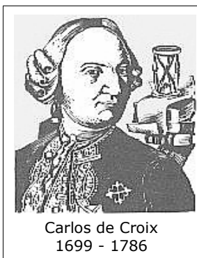
Carlos de Croix 1699 - 1786

De Jardín de San Carlos werd oorspronkelijk gebouwd als een bolwerk buiten de stadsmuren en dateert uit de veertiende eeuw. In de loop van de tijd kwam het tot verval maar werd in de achttiende eeuw heringericht als tuin voor Carlos F. de Croix, van oorsprong een Vlaming die in het Spaanse leger diende en van 1766 tot