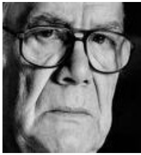
Camilo José Cela 1916-2002

Guadalajara is trots op een aantal schrijvers die er geboren zijn. In de eerste plaats natuurlijk Camilo José Cela die in 1989 de Nobelprijs voor literatuur won. Veel van zijn werk is in het Nederlands vertaald zoals De familie van Pascual Duarte en De Bijenkorf .