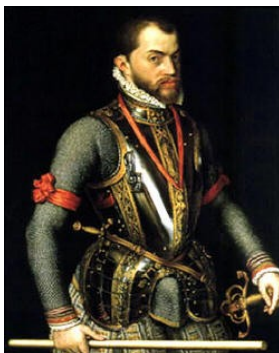
Filips II 1527 - 1598

Nu is El Escorial een stadje van ongeveer veertienduizend inwoners dat prima bereikbaar is vanuit de hoofdstad met de Cercanías , het onvolprezen regionale spoorwegsysteem dat Madrid rijk is. Natuurlijk geniet het vooral bekendheid vanwege het klooster dat in opdracht van Filips II werd gebouwd. Hij besloot daartoe ter nagedachtenis van de overwinning op 10 augustus 1557 van de Spaanse legers op de Fransen in de slag bij Saint-Quentin (zestig kilometer ten oosten van Amiens in Noord-Frankrijk). Op 15 april 1561 schreef Filips II aan het hoofd van de orde van Hiëronymus dat hij uit erkentelijkheid voor de Heer, die hem de overwinning had geschonken, een klooster zou laten bouwen.