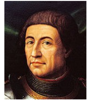
Alfons V 1396-1458

Ook in cultureel opzicht floreerde Valencia in de vijftiende eeuw. In 1442 veroverde de Aragonese koning Alfons V (de Edelmoedige) de stad Napels en voegde dit koninkrijk niet alleen toe aan Aragón, maar bracht ook zijn hof over naar de Italiaanse stad. Onder diens invloed bezochten tal van Napolitaanse schrijvers en schilders Valencia, wat bijdroeg aan de luister van de stad. Ook het onderwijs kreeg geruime aandacht, wat leidde tot de stichting van de universiteit van Valencia in 1502.