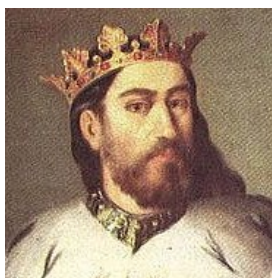
Jacobus I van Aragón 1208-1276

Na de inname van Valencia door Jacobus I werd Valencia de hoofdstad van een nieuw koninkrijk onder dezelfde naam, dat een juridisch zelfstandige eenheid vormde binnen de kroon van Aragón. Dit rijk telde toen onder zijn bevolking 120.000 islamieten, 65.000 christenen en 2000 joden die volgens de nieuwe wetgeving op hun plek konden blijven wonen zoals zij dat al deden vanaf het begin van de Moorse overheersing.