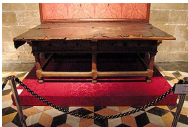
Taula de Canvis van Valencia

De zestiende eeuw bracht minder voorspoed. De bedrijvigheid in het Middellandse Zeegebied nam af, mede ten gevolge van de ontdekking van Amerika. Ook werd de stad in deze eeuw geteisterd door veel overstromingen van de Turia, waarvan die in 1517 de meeste verwoestingen toebracht. In 1519 brak de pest uit en in 1522 kwamen de gilden van handswerklieden in opstand. Deze achteruitgang leidde tot een afname van de bevolking zodat rond het jaar 1600 de stad nog maar 60.000 inwoners had. Het begin van de zeventiende eeuw wordt vooral gekenmerkt door de uitwijzing van de Moriscos , de onder dwang tot het christendom bekeerde Islamieten die hun geloof in verborgenheid bleven belijden. Hoewel de meeste Moriscos op het platteland woonden, betekende deze verwijdering ook voor de stad Valencia een flinke aderlating die leidde tot een economische crisis. De financiële beurs van Valencia ( Taula de Canvis , letterlijk ruiltafel) ging bankroet ten gevolge van het overstelpende aanbod van bezittingen van de Moriscos.