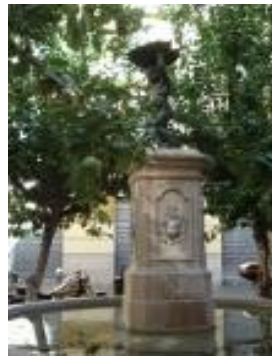
Plaza del Negrito