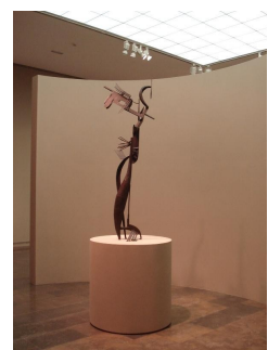
Plastiek Julio González