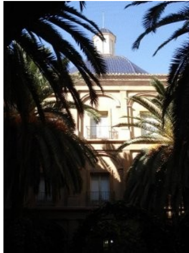
Museo de Bellas Artes