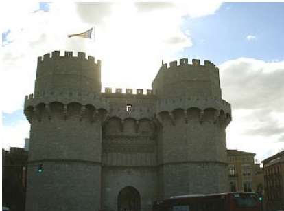
Torres de Serranos

Het hoofgebouw van het Palacio de la Generalidad , in het begin van de vijftiende eeuw in deels laatgotische deels renaissancistische stijl opgetrokken uit grote zandsteenblokken, is nog altijd de zetel van het bestuur van het Autonome Gebied Valencia. Het beschikt over fraaie zalen en een ruime patio. Vanaf het grote balkon kunnen de autoriteiten langstrekkende processies goed in ogenschouw nemen. Ook in dit complex zijn de zalen en plafonds geornamenteerd, vooral de koninklijke ontvangstaal.