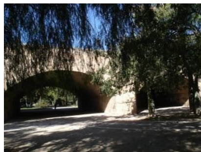
Jardín del Turia