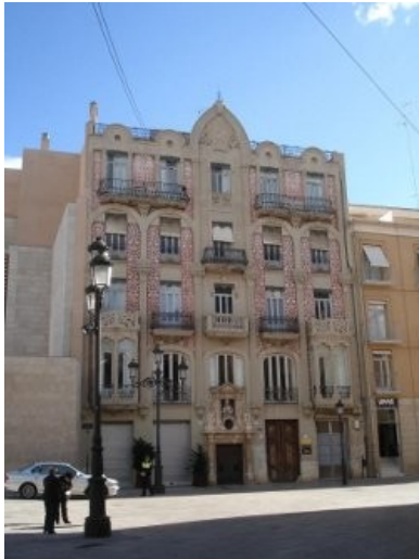
Fundación Municipal del Cine