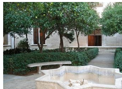
Patio de la Lonja de Seda