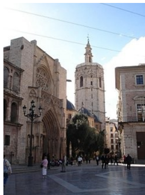
Kathedraal en Miguelete

De bouw van Lonja de la Seda , de zijdebeurs, begon in de vijftiende eeuw, toen Valencia een belangrijke handelsstad was. In dit gebouw werden eeuwenlang contracten afgesloten en processen op het gebied van handelsrecht gevoerd. Het gebouw is een voorbeeld van laatgotische bouwkunst, met een toren, zalen met spiralende zuilen en een mooie patio met sinaasappelbomen.