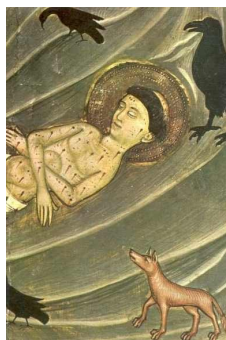
San Vicente Mártir