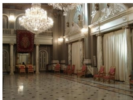
Salón de Cristal in het Ayuntamiento