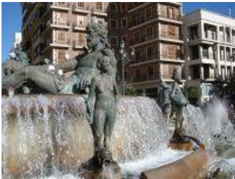
Plaza de la Virgen

Valencia, in bevolkingsoomvang overeenkomend met Amsterdam, is een uitermate levendige stad, waar royale parken en intieme patio's voldoende tegenwicht bieden tegen alle drukte. Door de gunstige ligging aan de Middellandse Zee is het weer er het gehele jaar uitermate mild. Het leven speelt er zich veelal op straat af. In het centrum met zijn rijkgeschakeerde architectuur bevinden zich diverse interessante musea en theaters.