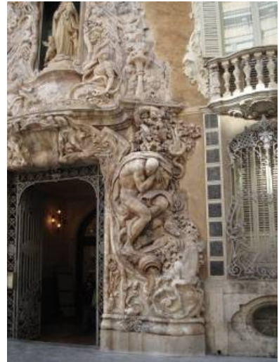
Museo Nacional Cerámica