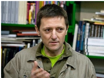
Ignacio Martínez de Pisón El día de mañana

Martínez de Pisón heeft al een aanzienlijk oeuvre opgebouwd. Meestal werkt hij aan enkele projecten tegelijk. In 1984 verscheen zijn eerste roman, La ternura del dragón , waarmee hij een bescheiden succes boekte. Behalve tot nu toe tien romans, sommige essayistisch van karakter, werden verschillende verhalen- en novellenbundels van zijn hand gepubliceerd. Zijn roman Carreteras secundarias uit 1996 – een van zijn meest gewaardeerde boeken – bewerkte hij het jaar daarna zelf tot script voor de gelijknamige film van de regisseur Emilio Martínez Lázaro en in 2003 opnieuw voor de Franse film Chemins de traverse van Manuel Poirier. Verder heeft Martínez de Pisón toneelbewerkingen gemaakt en nog enkele filmscripts vervaardigd. Zo leverde hij een bijdrage aan de animatiefilm Chico y Rita van Fernando Trueba. Over de Burgeroorlog stelde hij de verhalenbundel Partes de guerra samen, een selectie verhalen van diverse Spaanse auteurs. Ook schreef hij regelmatig literaire kritieken voor verschillende dagbladen.