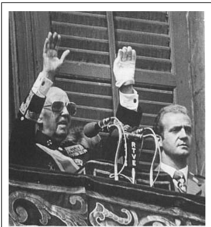
Franco en Juan Carlos in 1975

In 1957 werd het zelfs duidelijk dat zijn economische politiek met het streven naar autarkie ten dode was opgeschreven. Hij benoemde een aantal technocraten in zijn kabinet, waarvan de nieuwe minister van financiën Mariano Navarro Rubio en de technisch secretaris Laureano López Rodó, het meest invloedrijk waren. In maart 1959 werd een stabilisatieplan aangenomen, de peseta gedevalueerd en de overheidsuitgaven teruggedrongen. Wat Franco niet toestond was een drastische reductie van het leger en van het militaire budget. Vanaf dat moment liet Franco het financieel-economisch beleid aan de technocraten over. Een beslissing die al begin jaren zestig zijn vruchten zou afwerpen. De opbouw van de toeristenindustrie is daar misschien wel het duidelijkste voorbeeld van.