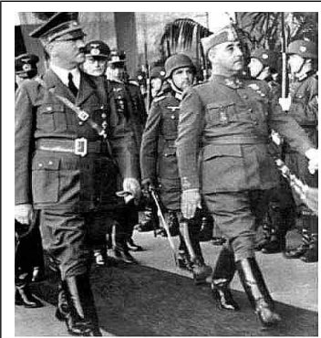
Franco en Hitler Hendaya 1940

Maar hij nam de vreemdste beslissingen. Zo was hem op de mouw gespeld door een geoloog dat Spanje rijk was aan gouderts in de Extramadura. Hij gaf order om te gaan delven. Ook geloofde hij het fabeltje dat een mengsel van water en plantenextracten zou kunnen dienen als brandstof, wat leidde tot een enorme fraude.