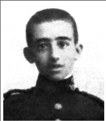
Franco als cadet, 1907

Omdat er voor Franco geen plaats was bij de marine, ging hij in 1907 naar de Militaire Academie in Toledo, waar hij vanwege zijn schriële gestalte (1.64m) en zijn hoge stem "Franquito" werd genoemd. Eén van zijn jaargenoten was Juan Yagüe, een toekomstige oorlogskameraad die later bekend zou worden als 'de slager van Badajoz'. In de Academie lag de nadruk uiteraard op militaire discipline en de strikt hiërarchische sfeer boodt Franco houvast. De opleiding was ouderwets, zonder veel praktijk en strategische analyse. In 1910 voltooide Franco zijn studie, waarbij hij eindigde als nummer 251 van de 312 cadetten. Niet goed genoeg voor directe uitzending naar Marokko waar in reactie op het verlies van 1898 het leger een koloniale onderneming was gestart en waar je als beginnend officier carrière kon maken. Pas begin 1912 kreeg Franco zijn kans in Marokko waar hij in de jaren tot 1926 met enkele onderbrekingen ruim tien jaar zou doorbrengen.