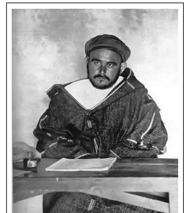
Abd el Krim 1882/83-1963

deze rang moest hij het legioen verlaten en kreeg hij in Spanje het bevel over de brigade van Madrid, een zeer prestigieuze post. Als politieke bagage bracht hij uit Marokko de opvatting mee over landsbestuur als patronage van gekoloniseerden die een stevige ouderlijke hand behoeften, een opvatting die hij altijd is blijven koesteren. Het jaar 1926 bracht Franco nog iets: de geboorte van zijn enige kind María del Carmen Franco y Polo.