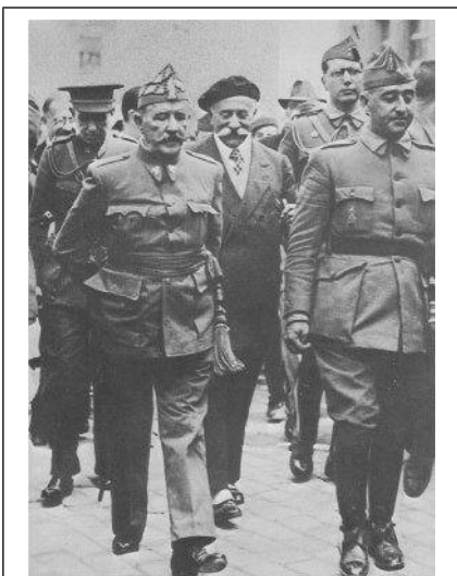
Franco (r) in Burgos, 1936

Op 18 juli 1936 brak de militaire opstand uit die slechts gedeeltelijk lukte. Franco nam de leiding in handen van de aan hem loyale legereenheden in Marokko. Met hulp van de Duitsers en Italianen werd een luchtbrug gecreëerd. Franco ontliet in de daaropvolgende strijd het risico van mislukking en was niet op snelle successen. Hij ging voor zekerheid, wat hem door sommige collega's niet in dank werd afgenomen, maar het getuigt wel van een strategisch inzicht waardoor hij zich gedurende de gehele Burgeroorlog zou laten leiden. In de eerste maanden van de oorlog bleek tevens dat Franco eenmaal ingenomen landsdelen voorgoed wilde 'bevrijden' van linkse elementen: 'In een Burgeroorlog is een systematische bezetting van territoria, gepaard aan de noodzakelijke zuivering te verkiezen boven een snelle opmars van legers dat een met vijanden geïnfecteerd land achterlaat.' Dit schoonmaken gebeurde op meedogenloze wijze: De opstandelingen executeerden systematisch hun tegenstanders.