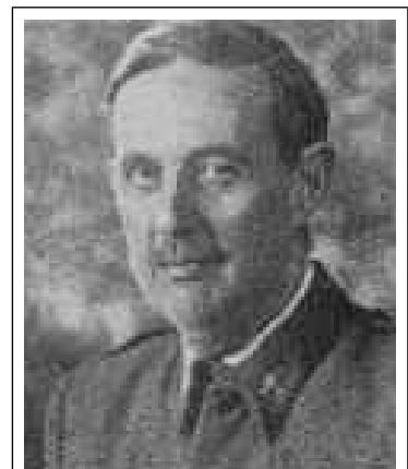
Alfredo Kindelán 1879- 962

In de zomer en herfst van 1939 rekende Franco af met een aantal hoge militairen die hem altijd gesteund hadden, maar die hij beschouwde als concurrenten. Zo werd generaal Kindelán, de man die Franco in 1936 voordroeg als Caudillo, maar altijd gepleit had voor herstel van de monarchie, weggezet via een benoeming op de Balearen, net zoals Franco zelf in 1933 was overkomen. Zijn eigen positie verstevigde hij met de Ley de la Jefectura del Estado op 8 augustus waardoor hij de bevoegdheid kreeg wetten uit te vaardigen zonder het kabinet te raadplegen. Dat gaf hem een machtspositie die vergelijkbaar is met die van de middeleeuwse koningen. Franco was ervan overtuigd dat de economische problemen zich zouden oplossen ten gevolge van een politiek gericht op volstrekte economische onafhankelijkheid (autarkie). Maar zijn in oktober gepresenteerde tienpuntenplan onderschatte volledig de mogelijkheden om imports substituten te creëren, export te bevorderen, zich te baseren op eigen grondstoffen en het kunnen stellen zonder buitenlandse investeerders. Ook de overwaardering van de peseta speelde een rol. De gevolgen waren desastreus en hongersnood kostte het leven aan duizenden Spanjaarden. Franco had het volk beloofd: 'geen huis zonder licht en geen Spanjaard zonder brood'.