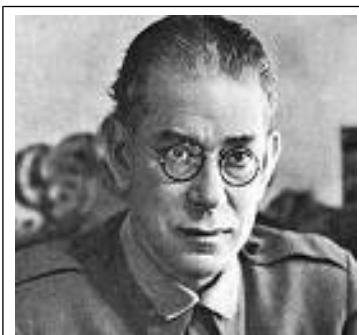
Emilio Mola Vidal 1887-1937

Na de verkiezingen raakte Spanje in een spiraal van geweld tussen links en rechts. In die toenemende chaos werd het initiatief tot een militaire opstand genomen door generaal Emilio Mola die zich verzekerd wist van een aantal getrouwen, maar toen nog niet van Franco die zijn diensten aan de regering aanbood om de chaos te bedwingen, waarmee hij aangaf dat het complot van Mola zou kunnen worden voorkomen. Of hij dit deed uit ultieme loyaliteit aan het gezag of uit opportunisme zal wel nooit helemaal duidelijk worden. Het aanbod werd afgeslagen, maar nog sloot Franco zich niet aan bij de opstandelingen. Dat gebeurde pas nadat een vooraanstaand leider van de rechtse oppositie, Calvo Sotelo, was vermoord, een week voordat de opstand zou uitbreken. Franco hield zijn kaarten graag lang tegen de borst.