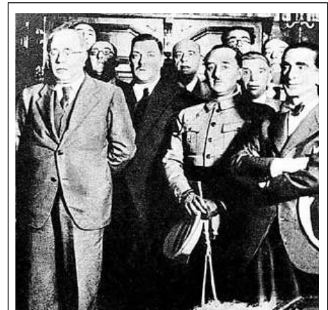
Azaña (l) en Franco in 1932

In april 1931 deed koning Alfons XIII afstand van de troon toen bij gemeenteraadsverkiezingen bleek dat in de grote steden de monarchistische aanhang was verdwenen. Spanje werd voor de tweede keer een republiek en de macht kwam in handen van een linkse regering waarin de republikein Manuel Azaña als minister van Oorlog formeel de superieur was van Franco. In plaats van Franco die positie te gunnen die hij innam in de jaren ervoor heeft Azaña voortdurend pogingen ondernomen om diens speelruimte te verkleinen, iets wat Franco niet kon verkroppen. In 1931 was Franco erop gebrand benoemd te worden tot Hoge Commissaris van Marokko, maar Azaña passeerde hem waarmee hij een kans liet lopen om Franco's loyaliteit te winnen. Ook het opheffen in juni 1931 van de militaire academie van Zaragoza, waaraan Franco leiding gaf, zette veel kwaad bloed evenals zijn benoeming in februari 1933 tot commandant generaal van de Balearen, een positie die hij beneden zijn waardigheid achtte.