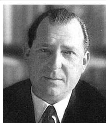
Don Juan de Borbón y Battenberg 1913 - 1993

Franco ontwikkelde in die tijd een passie voor film (hij had een privébioscoop) en hij schreef het script voor de film RAZA. De film geeft in elk geval wel zijn opvattingen over hoe Spanje geregeerd moest worden: zoals een vader heerst over zijn gezin, streng maar rechtvaardig.