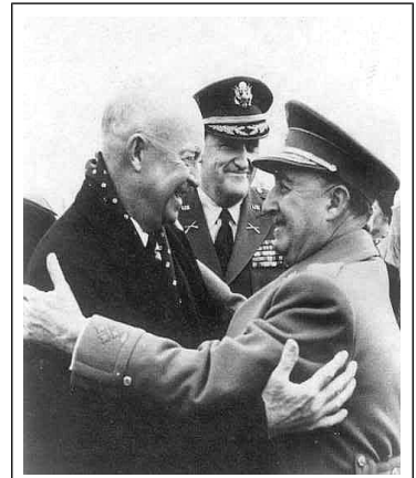
Eisenhower en Franco Madrid 1959

Het ging toen snel. In 1951 gaven de VS steun aan toetreding van Spanje tot de Verenigde Naties in ruil voor luchtmachtbases op het Iberisch schiereiland. Bij zijn inauguratie in januari 1953 benadrukte president Eisenhower het belang van goede relaties met Spanje en in september van datzelfde jaar werd een defensiepact tussen Spanje en de VS ondertekend. Maar Spanje werd wel buiten de Nato gehouden. Toetreding tot de verdragsorganisatie werd pas werkelijkheid in 1982, ruim na Franco's overlijden. Maar Franco beleefde wel een hoogtepunt in zijn buitenlandse carrière met de acceptatie van een uitnodiging aan Eisenhower voor een bezoek aan Madrid. Dat vond plaats in december 1959. Ook bij het Vaticaan boekte Franco succes. Reeds in 1948 startte overleg over een concordaat met de kerk dat in 1953 werd bekrachtigd.