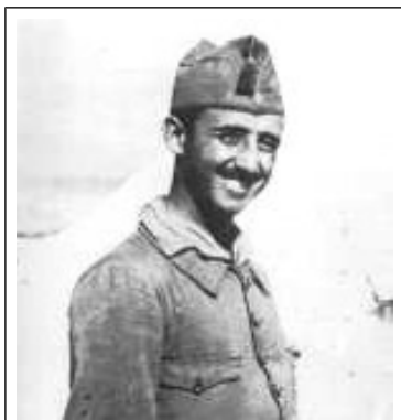
Franco in Marokko, 1920

In 1917 braken er sociale conflicten uit en werd er gestaakt in Asturië. Deze staking werd bloedig neergeslagen. Eén van de colonnes stond onder bevel van Franco die een beslissende rol speelde in het herstellen van de orde. In datzelfde jaar ontmoette Franco zijn toekomstige vrouw Carmen (Maria del Carmen Polo y Martínez Valdés), vijftien jaar oud. De familie moest eigenlijk niets weten van Franco. Carmen drukte echter door en de relatie bleef in stand, maar werd doorkruist door het aanbod aan Franco om vicecommandant te worden onder Millán Astray van het Spaanse Legioen ( Tercio de Extranjeros ), een bonte verzameling van huurlingen, desperado's, criminelen en pistoleros (revolverhelden).