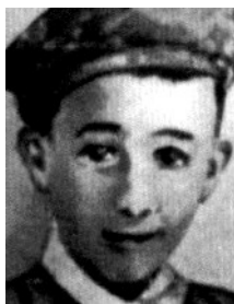
Francisco Franco in 1900

Dergelijke uitingen zijn begrijpelijk, maar geven natuurlijk geen inzicht in wat voor iemand Franco nu in werkelijkheid was. In elk geval was hij een sober mens die van jongsaf aan een afkeer had van zijn vaders losbandige levenswandel. De vroomheid van zijn katholieke moeder had een enorme invloed op zijn ontwikkeling. Gedurende zijn militaire loopbaan viel het zijn collega's al op dat hij niet dronk, geen belangstelling had voor vrouwen en nooit speelde of gokte. Dat is altijd zo gebleven en de enige dingen waaraan hij later verslingerd raakte, waren de jacht en het golfspel. Franco was zeker geen intellectueel en had moeite met het leren van een andere taal. In de periode vlak voor de burgeroorlog toen hij op de Canarische eilanden verbleef, nam hij privéles Engels, maar hij slaagde er niet in het echt meester te worden. Hij kon het noch goed verstaan, noch behoorlijk spreken.