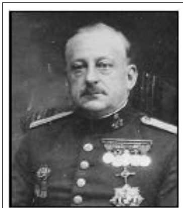
Miguel Primo de Rivera 1870-1930

1923 was ook het jaar waarin de militairen onder leiding van generaal Miguel Primo de Rivera een coup poging waagden en probeerden een militaire dictatuur op te zetten. Koning Alfons stemde in met de ontmanteling van de constitutionele monarchie en Primo de Rivera kreeg de absolute macht. De koning was besluiteloos over wat er met Marokko zou moeten gebeuren en Primo de Rivera had de neiging het op te geven,