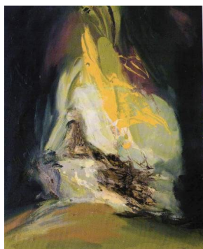
La dama del plumacho Domingo Mingos (1990)

matig geëxposeerd en vooral de cartoonachtige tekeningen, die dateren uit het begin van de vorige eeuw, zijn zeer trefzeker.