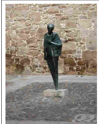
Alfonso Castelao 1885 - 1950

die wèl de moeite neemt Orense te bezoeken, is dat nu juist een van de aantrekkelijke kanten van de stad. Orense straalt een zekere rust uit en er is toch veel te zien. De kathedraal ( catedral de San Martin ), het Convento de San Francisco , de Plaza Mayor om enkele bezienswaardigheden te noemen. En op een verborgen pleintje een elegant standbeeld van de Galicische schrijver, schilder en tekenaar Alfonso Castelao. Castelao studeerde medicijnen en was een van de apologeten van het Galicisch nationalisme. Beroemd is zijn uitspraak " Fixenme médico por amor ó meu pai; non exerzo a profesión por amor á humanidade " (ik werd arts uit liefde voor mijn vader, niet uit uit liefde voor de mensheid oefende ik dit beroep uit). Zijn werk wordt regel-