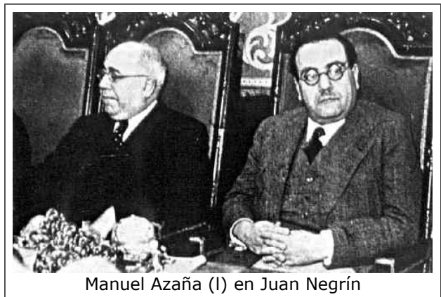
Manuel Azaña (I) en Juan Negrín

In reactie op de schendingen door Duitsland en Italië van de non-interventiepolitiek groeide bij linkse partijen overal ter wereld de kritiek en pleitten zij voor steun aan de republikeinen, wat de communisten ertoe bewoog om onder auspiciën van Komintern een begin te maken met de organisatie van de Internationale Brigades. Begin oktober maakte de Russische regering openlijk bekend dat zij, hoewel lid van het Non-interventie Comité, zich net als de Asmogendheden niet verplicht voelden zich aan de afspraken te houden. Wapenleveranties aan de Republiek begonnen op gang te komen via de havens van Cartagena en Alicante. En terwijl de steun vanuit Rusland groeide, zwol de kritiek uit conservatieve hoek op de Fransen aan, waardoor het voor de Spaanse regering steeds lastiger werd om het in Parijs gestalde goud om te zetten in deviezen voor wapenaankopen. Ook al omdat de in Burgos zetelende regering van Franco rechten deed gelden op de Spaanse goudvoorraad, ontstond er steeds meer animo onder de republikeinen om steun te zoeken bij de Sovjet-Unie. In feite was er geen alternatief, de Spaanse Republiek was door het westen in de steek gelaten.