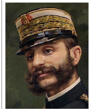
Alfonso XII 1857-1885

In 1874 werd een einde gemaakt aan de Eerste Spaanse Republiek en de monarchie onder het koningschap van Alfonso XII hersteld. Dat was het werk van de historicus Antonio Cánovas del Castillo, die gedurende de laatste kwart van de negentiende eeuw zonder twijfel de meest invloedrijke politicus was van Spanje. Hij creëerde een nieuw monarchaal stelsel dat ruimte bood aan een weliswaar conservatief getint, maar niettemin liberaal-kapitalistisch systeem waarin het primaat van de politiek lag bij de regering en de Cortes, met de koning als bewaker van de liberale staat. Sluitstuk van de politieke doctrine van Cánovas was de creatie van een systeem dat de conservatieve en meer progressief getinte bewegingen in staat stelde elkaar af te wisselen als regeringspartij. Als de ene partij was uitgeregeerd werd de koning gevraagd de regering te ontslaan en de Cortes te ontbinden. De daaropvolgende manipulaties met de verkiezingen brachten dan automatisch de andere partij aan de macht. Dit systeem, het zogeheten turnismo - had als voordeel dat het voortbestaan van de monarchie gegarandeerd was en voor de nodige stabiliteit zorgde na decennialang opblazende opstanden. Het turnismo werd vooral in stand gehouden door lokale caciques die op grote schaal verkiezingsfraude pleegden. Deze fraude staat in Spanje bekend als el pucherazo , afgeleid van het woord puchero ofwel de 'pot' waarin men valse stemmen bewaarde om later toe te voegen aan de stembussen. Deze term is nog steeds in zwang.