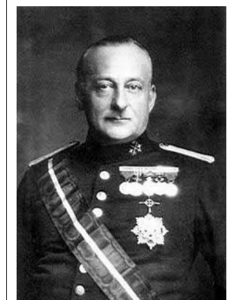
Miguel Primo de Rivera 1870-1930

Gesteund door de koning pleegde generaal Manuel Primo de Rivera in 1923 een staatsgreep. De grondwet werd buiten werking gesteld, de Cortes naar huis gestuurd en het Militair Directoraat nam het landsbestuur in handen. Geïnspireerd door hoe Mussolini vorm gegeven had aan de Italiaanse staat, koos Primo de Rivera ervoor om alle politieke partijen te verbieden en over te gaan tot een eenheidspartij: de Unión Patriótica . De persvrijheid werd aan banden gelegd, het gebruik van andere talen dan het Castiliaans verboden evenals het vertonen van regionale symbolen als de Baskische vlag. Het gevecht om de macht in Noord-Afrika werd hervat en na een groot offensief eindigde de Rifoorlog in 1926 met de overgave van Abd-el-Krim. De populariteit die Primo de Rivera genoot vanwege zijn succes in Marokko stelde hem staat een poging te wagen zijn regime te bestendigen door het een meer civiel karakter te geven. Hij verving het Militaire Directoraat door een burgerlijk bestuur, het Civiel Directoraat. Primo de Rivera had grootse plannen op sociaaleconomisch gebied: een combinatie van staatsinterventie in de economie en een programma van sociale hervormingen. Die hervormingen wilde hij realiseren via een corporatistisch model van harmonieuze samenwerking tussen werkgevers en werknemers, waarvoor hij steun zocht en kreeg van UGT-voorman Largo Caballero.