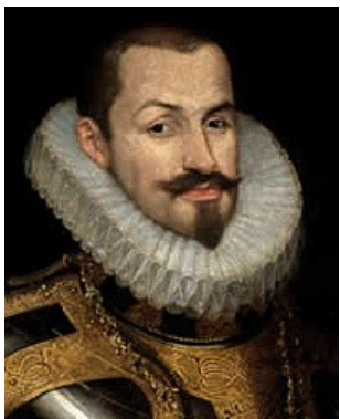
Hertog van Lerma 1552-1625

Het verschijnsel van de valido (vertrouweling) met veel invloed op de koning was niet nieuw in de Castiliaanse historie, maar het was voor het eerst dat een koning feitelijk de macht uit handen gaf toen Felipe III in 1598 de hertog van Lerma als zijn valido benoemde. Felipes keuze voor Lerma was onverstandig, want deze ontpopte zich als iemand die uit was op zelfverrijking en alle staatszaken daaraan ondergeschikt maakte. Felipe III, geboren in 1578, was de derde Habsburgse koning van Spanje en een kind uit het huwelijk van Felipe II met Ana de Austria. In 1599 trad Felipe III in het huwelijk met zijn veertienjarige nicht Margarita van Oostenrijk. Zij kregen acht kinderen, waaronder de troonopvolger Felipe IV, die het levenslicht zag in 1605. Felipe III kreeg als bijnaam 'De Vrome' en werd beschouwd als pacifist omdat hij twee belangrijke vredesverdragen tekende, dat van 1604 met Engeland en van 1609 met de Nederlanden (het twaalfjarig bestand). Maar het was geen pacifisme dat hem dreef. Castilië verkeerde in erbarmelijke economische omstandigheden en de kosten van het oorlogvoeren waren niet meer te dekken door middel van belastingverhoging.