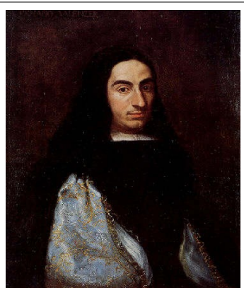
Fernando de Varenzuela 1636-1692

De Spaanse koning leefde in de hoop dat zijn zoon Baltasar Carlos, geboren in 1629, hem zou opvolgen, maar deze bezweek in 1648 aan de pokken. Op dat moment was Felipe de enig overgebleven mannelijke Spaanse Habsburger, wat hem ertoe dreef opnieuw een huwelijk aan te gaan. In 1649 trouwde hij met zijn volle nicht Mariana de Austria, de beoogde bruid van Baltasar Carlos. Zij schonk hem vijf kinderen waaronder de troonopvolger Carlos II, die in 1661 het levenslicht zag. Felipe IV overleed in 1665. Carlos II was mismaakt en ziekelijk, mentaal instabiel en niet in staat om nakomelingschap te verwekken. Zijn afwijkingen – gevolg van vele jaren van inteelt onder de Habsburgers – werden in zijn tijd geweten aan het werk van de duivel, vandaar zijn bijnaam El Hechizado (de behekste). Ook omdat Carlos II pas vier jaar oud was toen zijn vader overleed, trad zijn moeder op als regentes die werd geadviseerd door de Junta de Gobierno (bestuurscollege), ingesteld door Felipe IV om te voorkomen dat er weer een machtige valido de overhand zou krijgen. Gedurende enkele jaren bleef deze situatie bestaan, maar gaandeweg kwam er toch een nieuwe sterke man naar voren: Fernando Valenzuela. Mariana stelde zijn adviezen op prijs, zij het dat hij niet als de valido's die hem voorgingen staatszaken mocht afhandelen.