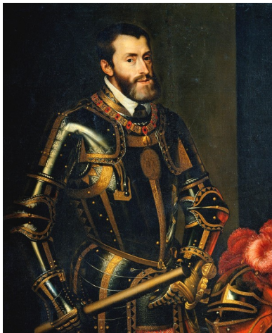
Carlos I 1500 - 1558

In 1504 erfde Juana de Castilla (Johanna de Waanzinnige) de troon van Spanje van haar moeder Isabel I. Vanwege de mentale instabiliteit van Juana werd haar vader, Fernando II, regent en vanaf 1517 vervulde haar zoon Carlos I de rol van koning naast Juana, die formeel koningin bleef tot aan haar overlijden in 1555. Carlos I werd geboren op 24 februari 1500 te Gent in Vlaanderen. Zijn moedertaal was het Frans, de taal die aan het hof gesproken werd, maar hij beheerste ook het Nederlands. Carlos was een vroom man, vooral vanwege de invloed die Adriaan van Utrecht - de latere en enige Nederlandse paus ooit, Adrianus - op hem had. In 1517 vertrok Carlos richting Spanje om daar tot koning Carlos I van Castilië te worden ingezworen. Begin 1519 overleed Maximilian I, keizer van het Heilige Roomse Rijk en om de keizerstroon te bemachtigen reisde Carlos af naar Aken. Omdat de Castilianen opdraaiden voor de kosten van deze campagne en vreesden dat met de kroning van Carlos I tot keizer, Castilië zou degraderen tot een dependance van het Habsburgse rijk, kwamen diverse steden in opstand. Deze opstand mondde uit in de oorlog van de Comunidades van Castilië die eindigde in 1522.