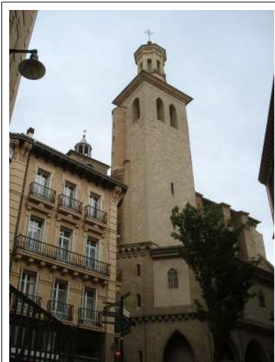
Kerk van San Saturnino

De stad Pamplona - die door de gemeente zelf Iruña wordt genoemd en in het Baskisch Iruñea heet - wordt vrijwel altijd geïdentificeerd met het stierenrennen: de encierro , waarbij tijdens de feesten van San Fermín (7-14 juli) elke dag enkele stieren door de nauwe straatjes van