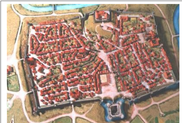
Pamplona in 1571. Aan de zuidzijde het Castillo de Santiago

van Navarra onder de kroon van Castilië een belangrijke rol speelde in de verdediging van het koninkrijk, besloot Ferdinand de fortificatie van de stad te moderniseren en gaf opdracht een kasteel te bouwen in het niemandsland buiten de stadsmuur op de plek waar zich destijds het klooster van Santiago bevond, dat gedoemd werd afgebroken te worden.