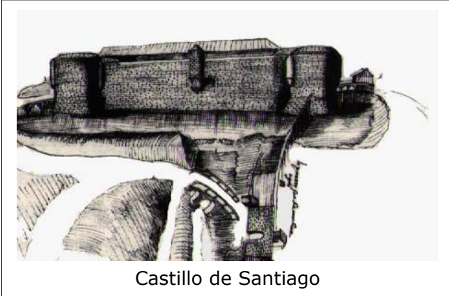
Castillo de Santiago

Pamplona werd als legerplaats gesticht rond 75 BC door de Romeinse veldheer Cnaeus Pompeius. Hij noemde deze vesting Pompaei-ilun (stad van Pompaeus) die uitgroeide tot de stad Pamplona en in de periode dat de Visigoten heersten over het Iberisch schiereiland hun bisschopszetel herbergde. Rond 715 veroverden de Moren Pamplona, dat daarna diverse keren doelwit was van aanvallen van zowel de Frankische koning Karel de Grote als de emirs van Córdoba. Zo werd de stad minstens twee keer met de grond gelijk gemaakt. De eerste aanwijzingen van de aanwezigheid van een stadsmuur dateert uit 778 toen Karel de Grote Pamplona verwoestte. Twee eeuwen erna was Pamplona een van de belangrijkste steden in de