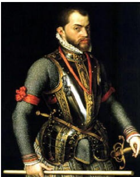
Filips II 1527 - 1598

Nu is El Escorial een stadje van ongeveer veertienduizend inwoners dat prima bereikbaar is vanuit de hoofdstad met de Cercanías, het onvolprezen regionale spoorwegsysteem dat Madrid rijk is. Natuurlijk geniet het vooral bekendheid vanwege het klooster dat in opdracht van Filips II werd gebouwd. Hij besloot daartoe ter nagedachtenis van de overwinning op 10 augustus 1557 van de Spaanse legers op de Fransen in de slag bij Saint-Quentin (zestig kilometer ten oosten van Amiens in Noord-Frankrijk). Op 15 april 1561 schreef Filips II aan het hoofd van de orde van Hiëronymus dat hij uit erkentelijkheid voor de Heer, die hem de overwinning had geschonken, een klooster zou laten bouwen.