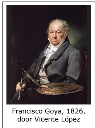
Francisco Goya, 1826, door Vicente López

Als hofschilder stelden Karel IV en Maria Louisa de geniale en veelzijdige Francisco de Goya y Lucientes (1746-1828) aan. Hij maakte vele portretschilderingen van de koninklijke familie en een in stijl opzienbarend en baanbrekend schilderij van de koninklijke familie (zie aan het eind van dit artikel). Ook portretteerde hij verschillende leden van de hofhouding, onder meer Cayetana de Silva y Álvarez de Toledo, de dertiende hertogin van Alva, die zijn muze werd, waardoor ze de afgunst van de koningin wekte. Voor het spraakmakende schilderij De naakte Maja schijnt Cayetana geposeerd te hebben. Toen de hertogin in 1802 op veertigjarige leeftijd aan een onduidelijke ziekte overleed, deden aan het hof geruchten de ronde dat zij in opdracht van de koningin, gedreven door jalouzie om de intieme relatie van de hertogin met Goya, vergiftigd was.