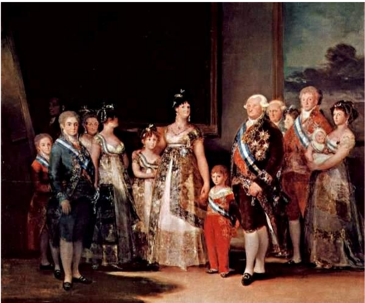
Francisco Goya: De familie van Karel IV, 1800

naar Napels, waar hij later in datzelfde jaar overleed. De latere koningin Isabella II, op driejarige leeftijd na de dood van haar vader tot koningin uitgeroepen, was een dochter uit het vierde huwelijk van Ferdinand VII, met Maria Christina. Deze koningin vertoonde dezelfde vastberadenheid en doortastendheid als haar grootmoeder, Maria Louisa.