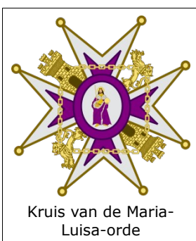
Kruis van de Maria-Luisa-orde

Na lang aandringen van de zijde van Maria Louisa stichtte haar gemaal in 1792 in navolging van andere Europese hoven, een damesorde, de Maria-Luisa-orde, bedoeld om adellijke dames te eren om hun diensten of kwaliteiten en aan het hof te binden. De koningin verrichtte de benoemingen en leidde de orde. De leden ontvangen een gouden kruis met een afbeelding van koning Ferdinand III (1199-1252) van Castilië die om zijn veroveringen op de Moren en zijn schenkingen aan de rooms-katholieke kerk al tijdens zijn leven De Heilige werd genoemd, al werd hij pas in 1671 gecanoniseerd. Als verplichting voor de maximaal dertig dames van de orde geldt het verrichten van charitas en het bijwonen van religieuze plechtigheden. In de loop der jaren ontvingen 1193 dames de eervolle benoeming tot lid van de orde. De meest recente benoemingen dateren van 2008.