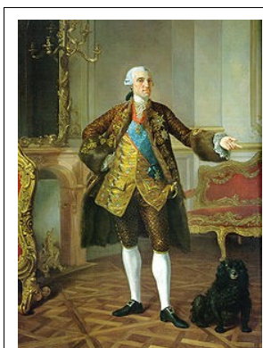
Filips van Parma, vader van Maria Louisa