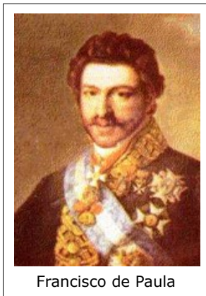
Francisco de Paula

De twee jongste kinderen, Maria Isabella en Frans Anton waren haar oogappels, maar de relatie met haar oudste zoon, kroonprins Ferdinand, was gespannen en later zelfs openlijk vijandig. Voor alle kinderen werden huwelijkspartners gevonden in de toonaangevende kringen van Europa. Maria Amalia huwde haar oom, zodat haar schoonouders tevens haar grootouders waren: Karel III en Maria Amalia van Saksen. Karel Maria werd Carlistisch troonpretendent na de dood van zijn oudere broer, Ferdinand VII, toen diens dochter Isabella II - doordat haar vader de Salische wet had afgeschaft - op de troon kwam en Karel Maria die regeling betwistte. Maria Isabella werd later de moeder van Ferdinand II. Frans Anton erfde de titel Francisco de Paula van Bourbon en zijn schoonouders waren Maria Isabella en Frans I der beide Siciliën.