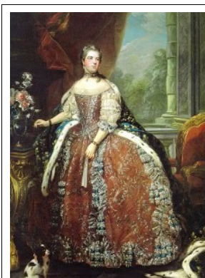
Louise Elisabeth, moeder van Maria Louisa

Maria Louisa was de jongste dochter van Filips van Bourbon, de hertog van Parma en Piacenza, en van prinses Louise Elisabeth van Frankrijk. Ze had buitengewoon illustere grootouders, van vaderszijde koning Filips V van Spanje en Elisabeta Farnese van Parma, van moederskant