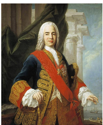
Zenón de Somodevilla Markies van Ensenada 1702-1781

Er zijn overeenkomsten tussen Ferdinand en een zijn voorgangers, de Habsburger Filips III die in 1598 de onnipotente Filips II opvolgde. Beiden erfden een Spanje dat zuchtte onder het juk van de imperiale oorlogen en zowel Filips III als Ferdinand VI leunden zwaar op hun eerste raadgevers die aankoersten op vredesonderhandelingen met andere Europese mogendheden. Niet dat zij pacifisten waren, maar vanwege hun realiteitszin, vandaar de bijnaam voor Ferdinand VI, El Prudente. Verschil tussen Filips III en Fernando VI was er wel: eerstgenoemde stelde zijn vertrouwen in de hertog van Lerma die zijn eigen belangen nastreefde en waarmee Spanje een periode van decadentie tegemoet ging, terwijl Ferdinand VI beschikte over een raadsman, Zenón de Somodevilla markies van Ensenada, minister van Oorlog, Marine en Financiën, die het landsbelang voor ogen had. Samen met de minister van buitenlandse zaken José de Carvajal bepaalde hij het beleid in de periode van 1746 tot 1754. Beide politici dienden al onder Filips V en kregen nu ruimte om hun herstel- en neutraliteitspolitiek gestalte te geven.