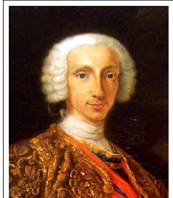
Karel III koning van Napels en Sicilië 1716-1788