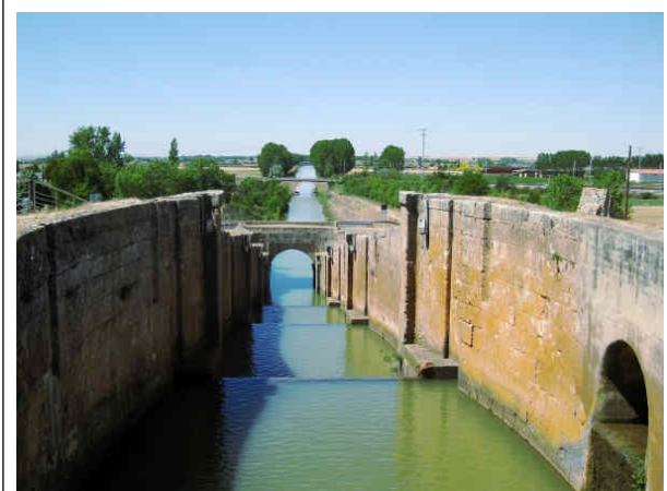
Canal de Castilla

Ondanks alle tegenstand kwam de Catastro langzaam maar zeker op gang en boekte Ensenada succes met de uitbanning van het bestaande systeem van intermediaire belastinginners waardoor veel geld door corruptie aan de schatkist onthouden werd. Hij verving dit stelsel door een vorm van directe inning door de staat. Een tweede succes was de creatie van de Giro Real , een bank in staatshanden die buitenlandse publieke en private transacties ondersteunde waarmee hij de gehate externe intermediairs buitenspel zette en die de schatkist geen windeieren legde. De bank verschaftte zekerheid en vergrootte haar succes door opening van