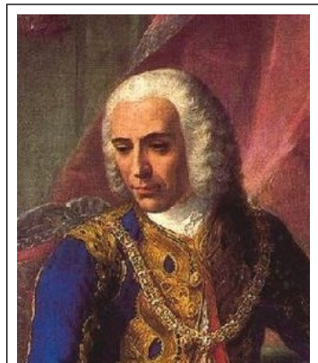
José de Carvajal 1698-1754

Rond 1750 beschikte Spanje over een leger dat qua omvang eenzesde was van dat van Frankrijk. Nog slechter was het gesteld met de marine: tegenover elk Spaans schip had Engeland er bijna negen. De plannen van Ensenada voorzagen erin deze scheve verhoudingen terug te brengen tot dat van een derde tot de helft in vergelijking met de andere mogendheden. De reorganisatie van het belastingstelsel bestond uit vervanging van provinciale inkomstenbelasting en belastingen op verbruiksmiddelen door vermogensbelasting, de Catastro . Ensenada stelde deze plannen voor niet zozeer uit compassie met de armen, maar omdat hij inzag zag het zwaarder belasten van armen dan van rijken rampzalig was voor de ontwikkeling van een gezonde economie waarin het werken in de landbouw en industrie voor arbeiders aantrekkelijk moet zijn. Natuurlijk verwachtte hij verzet van de adel en trachtte hun weerstand weg te nemen door uitvoering van een proefneming in Guadalajara, die succesvol bleek, maar zag zich genooddaakt zeer omzichtig te opereren. Hij wilde de adel nu ook weer niet tegen zich innemen en daarmee zijn positie op het spel zetten.