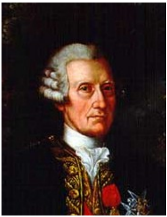
Richard Wall 1694-1777

In 1754 overleed minister Carvajal die werd opgevolgd door Richard Wall, van Ierse afkomst, die in het Spaanse leger onder Filips V had gediend en voor Ensenada diplomatieke missies uitvoerde. Vlak daarop werd de positie van Ensenada onhoudbaar. Dat was het gevolg van diens eigengereide optreden in het Caribisch gebied waar hij een ware anti-Engeland campagne ontketende. Tegenstanders van Ensenada aan het hof, de Engelse ambassadeur Benjamin Keene en Richard Wall uitten ernstige beschuldigingen aan het adres van Ensenada en de druk op Ferdinand VI om de markies te ontslaan werd groot. Ferdinand, die de relatie met Engeland niet in de waagschaal wilde stellen, zette Ensenada aan de kant en verbande hem naar Granada.