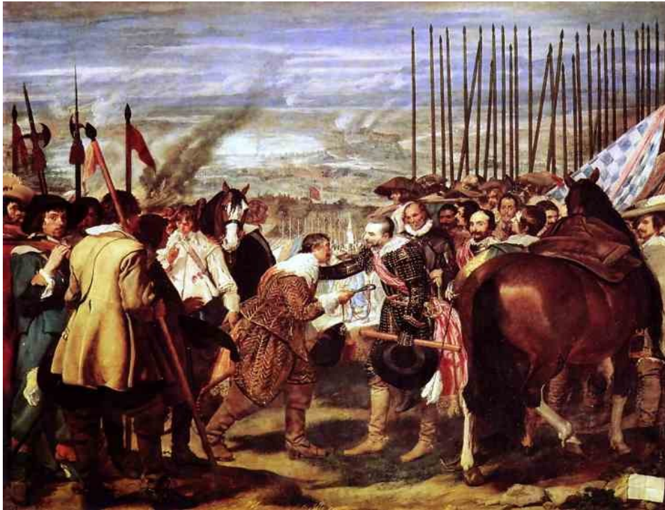
Diego Velázquez: De overgave van Breda (ofwel: De lansen), 1635