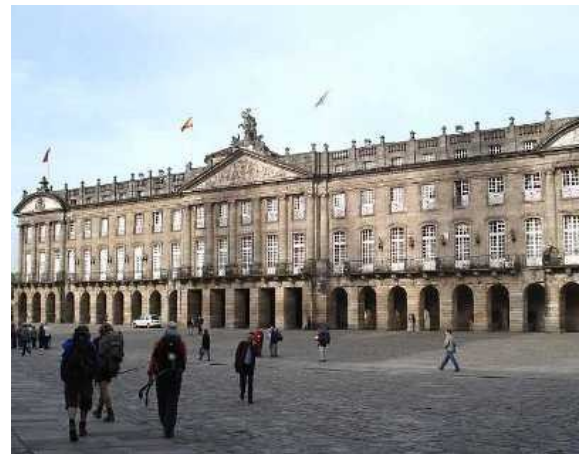
Ayuntamiento de Santiago de Compostela

Terug naar het centrum, naar het Praza do Obradoiro, waaraan behalve de kathedraal ook het gemeentehuis (ayuntamiento) gelegen is. Het doet door de strakke en symmetrische bouwvorm een beetje denken aan het Paleis op de Dam te Amsterdam, maar past veel beter in zijn omgeving zo tegenover de kathedraal en naast het Hostal de los Reyes Católicos. Dit voormalige gastenverblijf voor pelgrims dat eind vijftiende eeuw werd gebouwd op last van de Reyes Católicos (Katholieke koningen), Ferdinand van Aragón en Isabella van Castilië, die de bedevaartsplaats Santiago een warm hart toedroegen. Het Hostal wordt gerekend tot de meest luxueuze hotels van Europa en zal voor slechts een enkele pelgrim te betalen zijn (de kamerprijzen bewegen zich rond de 250 euro per nacht), maar gelukkig is er een nieuw onderkomen voor de pelgrims in het Convento de Belvís , een eind uit het centrum en hoog gelegen aan de rand van het Parque de Belvís, van waaruit je overigens een fraai uitzicht hebt op de stad.