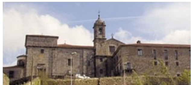
Convento de Belvís