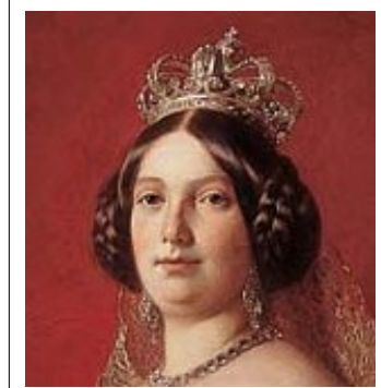
Isabel II 1830-1904

Na het overlijden van koning Fernando VII in 1833 werd zijn vrouw María Cristina benoemd als regentes voor de nog geen drie jaar oude Isabel II. María was nog maar net in functie toen een carlistische opstand uitbrak, het voorspel voor de Eerste Carlistenoorlog. De kosten van de strijd tegen de carlisten werden bestreden door onteigening van kerkelijke bezittingen. Door deze bezittingen publiekelijk te veilen kwamen zij in handen van de rijke elite. Het vulde de schatkist, maar van het liberale uitgangspunt om de gronden eerlijk te verdelen kwam niets terecht. In 1836 bracht het vigerende censuskiesrecht, dat was ingesteld met het Koninklijk Statuut van 1834 en waardoor nog geen half procent van de bevolking naar de stembus kon gaan, een overwinning voor de gematigde liberalen. Dat gaf aanleiding tot felle protesten die de regentes dwongen tot het in werking stellen van de grondwet van Cádiz uit 1812. Na verkiezingen kwamen de progressieven aan de macht.