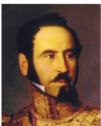
Baldomero Espartero 1793-1878

De carlisten, een ultraconservatieve beweging die zich sterk maakte voor herstel van de absolute monarchie onder koningschap van de broer van Fernando VII, Carlos, begonnen een eerste oorlog in 1834. Zij hadden vooral succes in het noorden waar deze beweging haar oorsprong had, maar doorstoten naar het zuiden lukte niet. De Eerste Carlistenoorlog eindigde in 1840 toen generaal Baldomero Espartero de carlisten versloeg. In 1837 kwam een nieuwe grondwet tot stand die zicht bood op samenwerking tussen progressieve en gematigd liberalen. Zij bleven elkaar echter wantrouwen en de daaruit voortvloeiende instabiliteit bracht in 1840 regentes María Cristina ertoe haar taken over te dragen aan de populaire generaal Espartero. Zij kon terugkijken op een periode waarin de industrialisatie in Spanje tot ontwikkeling was gekomen.