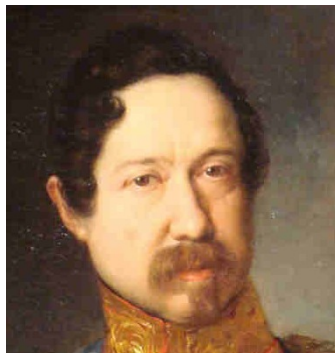
Ramón María Narváez 1800-1866

Zijn conservatieve evenknie, veldmaarschalk Ramón María Narváez, nam de macht over. Hij introduceerde in 1845 een nieuwe, behoudende grondwet die de maatschappelijke orde onder de traditionele hiërarchische verhoudingen handhaafde. Nieuwe wetgeving kwam er ook om de effectiviteit van belastinginning vergroten. Er kwam onderscheid tussen een directe belasting in rurale streken (onroerend goed, landbouw en veeteelt) en een indirecte in geurbaniseerde gebieden (verbruiksbelasting).