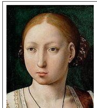
Johanna I van Castilië 1479-1555