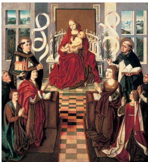
Op dit schilderij wordt de verbintenis weergegeven tussen de maagd Maria met Jezus en de Katholieke koningen Isabella (rechts) en haar man Ferdinand (links).

Tijdens deze periode zijn er slechts twee koninginnen geweest die de volledige rechten erfden op de troon en optraden als regerend koningin (reina propietaria): Isabella I, de katholieke koningin en haar dochter Johanna I van Castilië. De andere koninginnen fungeerden als koningin-gemalin (reina consorte) van de koning, wat overigens niet inhield dat zij geen macht uitoefenden. Zij ontleenden gezag uit hun rol als hoedster van christelijke deugden en liefdadigheid. Bovendien werden zij opgeleid in kwaliteiten die niet des konings waren: talen, geschiedenis en schone kunsten.