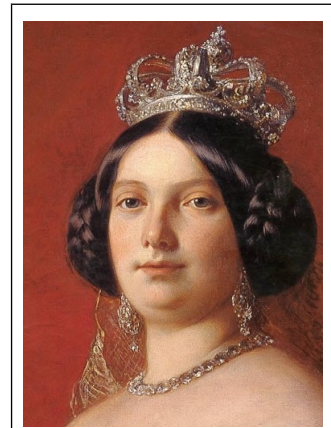
Isabella II 1830-1904

In 1878 huwde Alfons XII Maria Christina, aartshertogin van Oostenrijk. Dit huwelijk duurde tot november 1885, toen Alfons overleed. Uit het huwelijk waren twee dochters geboren en toen Alfons stierf was Maria Christina zwanger. Dit bracht een ongekennde situatie met zich mee. Wanneer de nakomeling een meisje zou zijn, zou het geen probleem opleveren om de eerstgeborene uit te roepen tot erfopvolgster, maar wanneer dat gedaan zou zijn en de nakomeling bleek een jongetje, zou er een ernstig belangenconflict ontstaan en juridisch moeilijk de aanwijzing van de eerstgeborene ongedaan te maken. Dus werd besloten de geboorte af te wachten. Het werd een zoon, Alfons XIII en Maria Christina werd regentes totdat Alfons meerderjarig werd verklaard in 1902. Zij was een bijzondere vrouw en werd wel doña Virtudes (de deugdzame) genoemd. Ze stierf in 1929 en de ondergang van de monarchie in 1931 maakte ze dus niet meer mee.