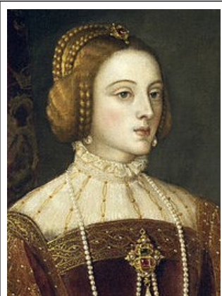
Isabella van Portugal 1503-1539

Daarmee werd het Habsburgse huis in Spanje geïntroduceerd. De zoon van Ferdinand en Johanna, Karel I, werd later Karel V, keizer van het Heilige Roomse Rijk. Johanna oefende nooit echt de macht uit omdat de mannelijke familieleden het haar permanent moeilijk maakten. Toen Filips de Schone vlak na zijn benoeming tot koning overleed, nam de mentale kracht van Johanna sterk af en liet Ferdinand haar voor gek verklaren, vandaar de naam waaronder zij de geschiedenis zou ingaan: Johanna de Waanzinnige. Ferdinand, die al vanaf het overlijden van Isabella in 1504 Johanna onder verstikkend toezicht had gesteld, liet haar opsluiten in Tordesillas, nabij Valladolid. Bij testament benoemde hij Karel tot bewindvoerder van het koninkrijk van Castilië en León in naam van koningin Johanna. In 1518 werd Karel door de Cortes van Castilië tot koning van Spanje uitgeroepen naast zijn moeder. Na de dood van Ferdinand behandelde Karel zijn moeder op dezelfde, weinig zachtzinnige manier als zijn vader en nam feitelijk de macht van haar over.