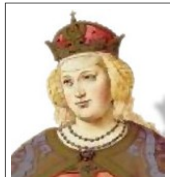
Urraca I van León 1081-1126

In Castilië en León was de situatie anders. Daar werd de Visigotische traditie voortgezet en trad Urraca, dochter van koning Alfons VI die in 1109 overleed, op als regerend vorstin van tot 1126. In 1109 huwde zij met Alfons I van Aragón, naar wens van haar vader die in deze verbinding een versteviging zag van de dynastieke rechten. Maar het was een slecht huwelijk en het werd vijf jaar later zelfs officieel ontbonden. Gedurende deze periode bleek dat hoewel Urraca de volledige rechten bezat op de troon, zij toch een mindere positie innam dan wanneer zij een man zou zijn geweest. Alfons van Aragón trok veel macht naar zich toe en noemde zich zelfs keizer van geheel Spanje. Bovendien werd bij het huwelijk bepaald dat Alfons de domeinen in bezit zou krijgen van zijn overleden schoonvader die weer teruggegeven zouden worden aan Urraca wanneer aan het huwelijk een eind zou komen, hetgeen geschiedde. Gedurende haar gehele regeringsperiode voerde zij oorlog met haar ex-man, maar wist zich met behulp van haar zoon en opvolger Alfons VII goed te handhaven.