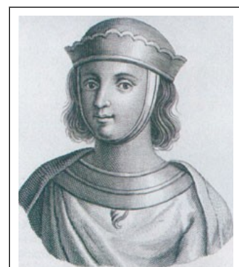
Berenguela van Castilië 1180-1246

Ander voorbeeld van een invloedrijke koningin in de middeleeuwen was Berenguela van Castilië, geboren in 1180, dochter van Alfons VIII van Castilië. In 1197 huwde zij met Alfons IX van León, een verbintenis waaruit Ferdinand III werd geboren die zowel de Castiliaanse als de Leonese troon zou erven. Berenguela was regentes vanaf 1214 toen Alfons VIII overleed en haar broer Hendrik, de troonopvolger, nog zeer jong was. Toen deze ook overleed in 1217 erfde Berenguela alle koninklijke rechten die zij onmiddellijk overdroeg aan haar oudste zoon Ferdinand III. Berenguela vervulde de rol van koningin-moeder met verve en stelde alles in het werk om de rechten van haar zoon te verdedigen.