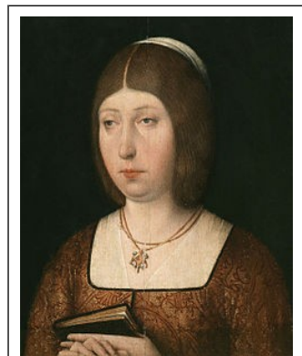
Isabella I 1451-1504

Groter verschil dan tussen Isabella I en haar dochter Johanna (niet te verwarren met la Baltraneja) die haar als wettig koningin opvolgde is nauwelijks denkbaar. Johanna, die lichamelijk en mentaal zwak was kwam op de troon als Johanna I van Castilië omdat de enige zoon van Isabella, Johan, en haar oudste zus Isabella vroeg overleden waren. Johanna huwde op instigatie van haar ouders, die de banden met het Habsburgse huis wilden aanhalen, in 1496 de aartshertog van Oostenrijk, Filips de Schone, die in 1506 naast zijn echtgenote werd uitgeroepen tot koning van Spanje als Filips I.