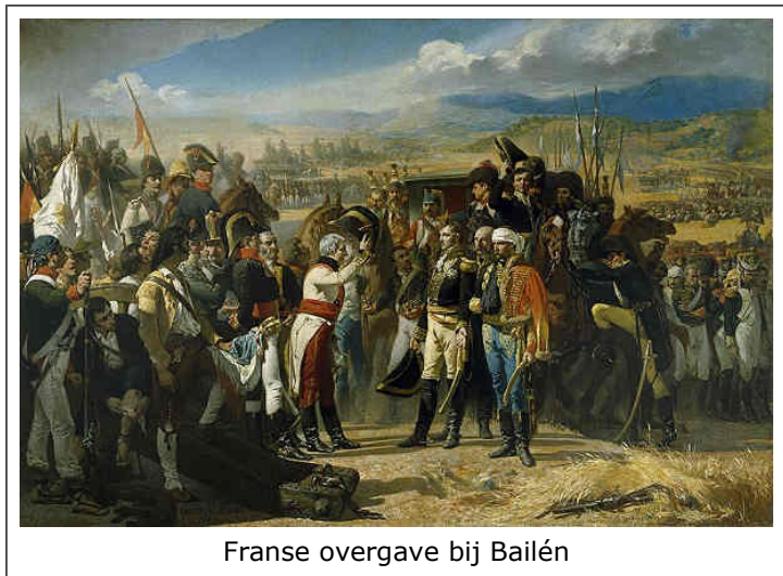
Fransen overgave bij Bailén

Voor de leiders van de plaatselijke junta's was het duidelijk dat om de oorlog te kunnen winnen er een centrale orgaan moest komen dat in staat zou zijn de benodigde financiële middelen bijeen te krijgen en leiding te geven aan het revolutionaire proces. Enkele dagen voor de slag bij Bailén liet de junta van Valencia via een manifest weten voorstander te zijn van de oprichting van een Junta Suprema Central , die na de op verschillende plaatsen in het land gevoerde discussie tot stand kwam op 25 september en gevestigd werd in de koninklijke residentie Aranjuez. Aan het hoofd daarvan stond de voormalige eerste minister Floridablanca en de leiding over het opstandelingenleger, het ejército del Centro , werd toevertrouwd aan Castaños.