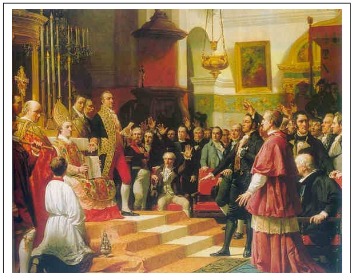
Inauguratie van de Cortes van Cádiz in 1810

Op 24 september kwam de nieuwe Cortes voor het eerst bijeen op het Isla de León nabij Cádiz, waarna in februari 1810 de officiële inauguratie volgde in de kerk van San Felipe Neri in de stad zelf. Op die dag legitimeerde de Cortes zijn bestaan door te verwijzen naar de soevereiniteit van het volk, de natie die zij vertegenwoordigde, waarmee de positie van de kroon ingrijpend werd gewijzigd. Een revolutionaire omwenteling zonder weerga. De samenstelling van de Cortes was tamelijk gevarieerd, zij het dat de clerus (97), advocaten (60), bekleeders van openbare functies (55) en militairen (37) het leeuwendeel uitmaakten van de 300 afgevaardigden. Uit deze samenstelling kan onmogelijk de politieke gezindheid van de leden van de Cortes worden afgeleid, er waren immers geen politieke partijen. Uit de verslagen van de stemmingen kan echter worden afgeleid dat in de diverse hierboven genoemde beroepsgroepen zich zowel conservatieven als progressieven bevonden. Over het algemeen voer de Cortes een gematigde koers en werd de nadruk gelegd op de noodzaak tot verandering en niet zozeer op verzet als zodanig. Wel manifesteerden sommige vertegenwoordigers zich als verdedigers van regionale belangen, ofschoon dat niet belemmerend werkte. De afgevaardigden uit de koloniën traden wel op als een homogeen blok en gaven steun aan hen die het meest aan hun eisen tegemoet kwamen.