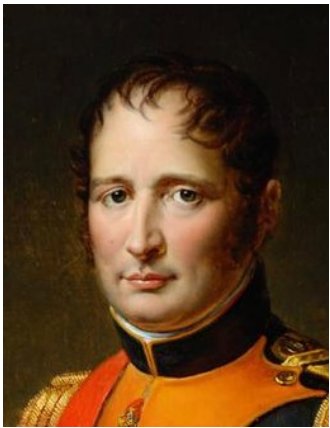
Jozef I Bonaparte 1768-1844