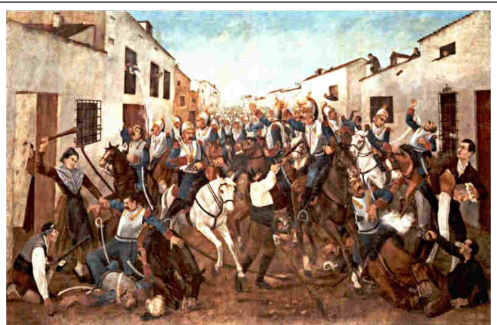
Strijd in Valdepeñas