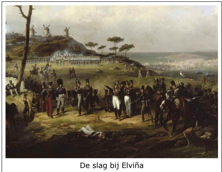
De slag bij Elviña

Ook in Galicië boekten de Fransen succes. Nadat in augustus 1808 het Britse leger onder aanvoering van Arthur Wellesley - de latere lord Wellington - de Franse opmars had gestuit in de slag bij Vimeiro werd de positie van de Britse troepen ernstig bedreigd door de troepen van de inmiddels gearriveerde Grande Armée van Napoleon. De Engelse commandant John Moore werd gedwongen zich terug te trekken in La Coruña. Het barre winterweer en de voortdurende schermutselingen tijdens de aftocht kostten duizenden Britse soldaten het leven. Eenmaal aangekomen in La Coruña, waar schepen klaarlagen om de troepen te evacueren, bonden de Engelsen nog een laatste keer de strijd aan met de hen achtervolgende Fransen onder commando van maarschalk Soult. In de slag van Elviña nabij Coruña in januari 1809 wist Moore een totale vernietiging te voorkomen en een succesvolle evacuatie te realiseren. Moore zelf werd in de strijd dodelijk gewond.