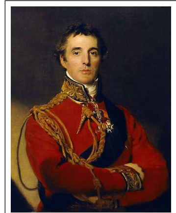
Arthur Wellesley 1769-1852