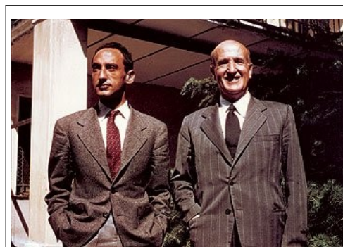
Carlos Bousoño en Vicente Aleixandre, ca. 1950