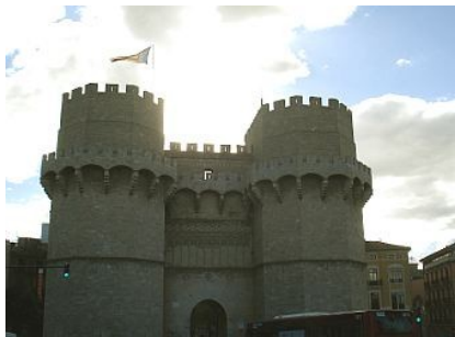
Torres de Serranos

Het hoofgebouw van het Palacio de la Generalidad , in het begin van de vijftiende eeuw in deels laatgotische deels renaissancistische stijl opgetrokken uit grote zandsteenblokken, is nog altijd de zetel van het bestuur van het Autonome Gebied Valencia. Het beschikt over fraaie zalen en een ruime patio. Vanaf het grote balkon kunnen de autoriteiten langstrekkende processies goed in ogenschouw nemen. Ook in dit complex zijn de zalen en plafonds geornamenteerd, vooral de koninklijke ontvangstaal.