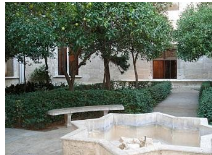
Patio de la Lonja de Seda