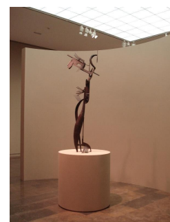
Plastiek Julio González