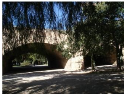
Jardín del Turia