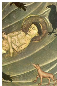
San Vicente Mártir