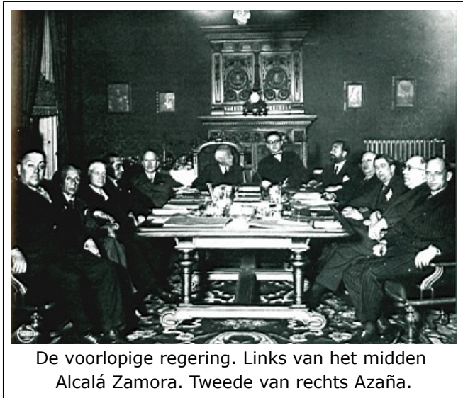
De voorlopige regering. Links van het midden Alcalá Zamora. Tweede van rechts Azaña.

Om de mening van het volk te peilen besloten koning en regering tot het houden van gemeenteraadsverkiezingen. Deze vonden plaats op 12 april 1931. In absolute aantallen eindigden zij weliswaar in een overwinning van de traditionele partijen, maar de overwinning van links in de belangrijke bevolkingscentra was zó eclatant dat de koning