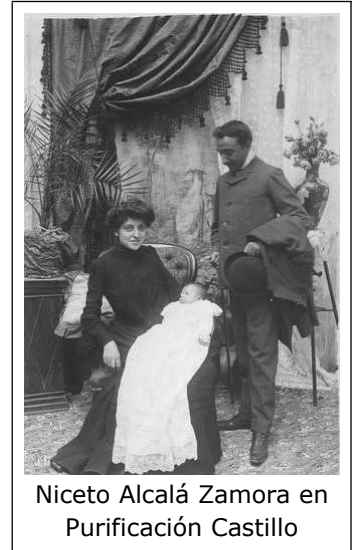
Niceto Alcalá Zamora en Purificación Castillo

Niceto Alcalá Zamora werd op 6 juli 1877 geboren in het plaatsje Priego, gelegen op ongeveer 100 km ten zuidoosten van Córdoba. Zijn beide ouders kwamen uit welgestelde, rooms-katholieke en liberaal denkende families, getuige de vele geschilderde portretten van beroemde negentiend-eeuwse progressieve voorlieden die de wanden van het ouderlijk huis sierden. In deze omgeving werd de basis gelegd voor zijn oprechte neiging om Spanje te behoeden voor extremisme, een keuze voor de kalmte van het politieke midden. Alcalá