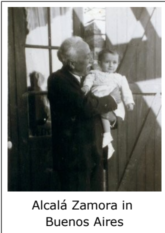
Alcalá Zamora in Buenos Aires

De familie Alcalá Zamora wachtte de gebeurtenissen niet af en vertrok richting Parijs, waar zij enkele jaren woonde. In 1938 ontving