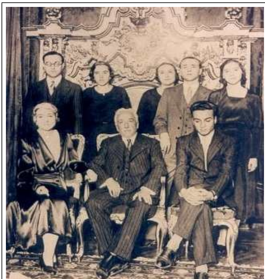
Familie Alcalá Zamora bij de presidentsbeëdiging, december 1931

Overwegingen om dit aanbod te accepteren waren het gebrek aan andere geschikte kandidaten en zijn wil om rooms-katholiek Spanje te beschermen tegen het rabiāt anticlericalisme van links.