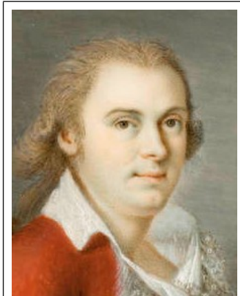
Manuel Luis de Urquijo 1769-1817

Urquijo staat vooral bekend om zijn plan de Spaanse rooms-katholieke kerk weg te halen onder het gezag van de paus en onder dat van de monarchie te plaatsen: het schisma van Urquijo. Gebruikmakend van het feit dat op dat moment de Fransen