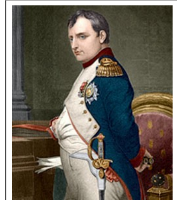
Napoleon Bonaparte 1769-1821

De Oorlog van de Conventie, ook wel de oorlog van Roussillon of Pyreneeënoorlog genoemd, was onderdeel van de ultieme poging van de belangrijke Europese mogendheden om een einde te maken aan de Franse Revolutie en de monarchie te redden. Belangrijkste strijdtoneel waren de Catalaanse Pyreneeën en de ten noorden ervan gelegen provincie Roussillon. Daarnaast werd gevochten in de Baskische regio en trachtte een Engels-Spaanse vloot steun te verlenen aan de Franse koningsgezinden die in Toulon belegerd werden door de revolutionairen. Een van de aanvoerders van deze belegeraars was de jonge artillerie-officier Napoleon Bonaparte. In het eerste jaar van de oorlog trok het Spaanse leger de Pyreneeën over en wist het diverse steden te veroveren, maar de inname van Perpignan, hoofdstad van de Roussillon, mislukte. Nu zag het zag er voor de revolutionairen somber uit en de gemeenschappelijke inspanning van Engeland, Spanje, Pruisen, Oostenrijk, de Republiek der Nederlanden en koningsgezinde steden als Toulon leek succes te brengen. Maar een gigantische 'ronseling van de massa' bracht meer dan een miljoen mensen onder de wapenen en de daaruit geformeerde legers begonnen aan een serie overwinningen die het verloop van de oorlog keerden. De Engels-Spaanse vloot zag zich genoodzaakt de strijd om Toulon op te geven. Franse troepen drongen 1794 Catalonië binnen en dwongen de Spanjaarden tot overgave van de vesting van San Fernando de Figueras.