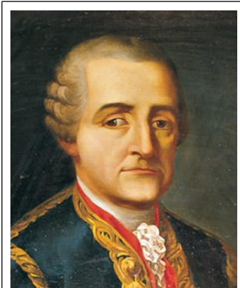
Graaf van Aranda 1719-1798

Aranda die maakte een einde aan de Junta Suprema de Estado die naar zijn mening de rol van de edelen als natuurlijke raadgevers van de monarch ten onrechte marginaliseerde. Aranda blies de oude Raad van State weer leven in: de koning omringd door leden van de hoge adel. De eerste zitting werd opgeluisterd met oude gebruiken zoals de eedaflegging op de knieën en het kussen van de hand van de koning. Als oud-ambassadeur van Frankrijk kende Aranda dit land door en door en in het besef van de kracht van Frankrijk probeerde hij er alles aan te doen om de Spaanse neutraliteit ten opzichte van diens noorderbuur te handhaven. Hij ging ervan