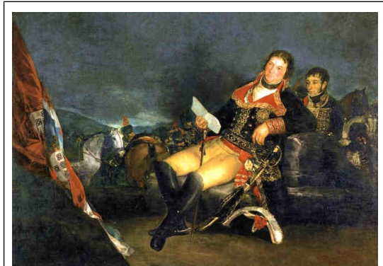
Godoy als overwinnaar van de Guerra de las Naranjas

Dat leidde begin 1801 tot een ultimatum van Godoy aan de Portugezen om hun havens te sluiten voor Britse schepen. Zoals te verwachten was weigerde het buurland van Spanje om op deze eis in te gaan, waarna Spanje aan Portugal de oorlog verklaarde. Een gecombineerde Spaans-Franse strijdmacht drong Portugal binnen. Toen een bezetting van Lissabon dreigde gaf Portugal toe en eindigde de oorlog met de vrede van Badajoz, waarbij het land zich verplichtte zijn havens te sluiten voor Britse schepen, enkele nog openstaande oorlogsschulden te voldoen en het grensstadje Olivenza over te dragen aan Spanje. De naam van dit kortdurende conflict is ontleend aan de tros sinaasappels die Godoy bij wijze van waarschuwing stuurde aan de Portugese koningin Maria I toen hij de Portugese grensplaats Elvas belegerde en vandaar via de Taag naar Lissabon dreigde door te stoten.