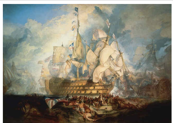
De slag bij Trafalgar

Gedurende deze Spaans-Engelse oorlog, die eindigde in de zomer van 1808, bewezen de Britten opnieuw hun superioriteit op zee. Tijdens diverse aanvallen op de Iberische en Zuid-Amerikaanse kusten bracht de Royal Navy de gecombineerde Spaans-Franse zeestrijdkrachten grote schade toe. Maar de beslissende slag, een slag die een keerpunt in de historie markeerde, was die in oktober 1805 bij kaap Trafalgar, gelegen iets ten zuiden van de Spaanse havenstad Cádiz. Napoleon, inmiddels gekroond tot keizer, had plannen gemaakt om Engeland te veroveren. Daartoe bracht hij een enorm leger bijeen op het continent. Om dit leger veilig te kunnen laten landen aan de Britse kust was het nodig het kanaal gedurende minstens een etmaal onder controle te hebben. Gekozen werd voor een afleidingsmanoeuvre die het weglukken van de Britse marine door de Spaans-Franse vloot beoogde. Vanuit Cádiz zou deze vloot onder aanvoering van admiraal Pierre Villeneuve koers zetten naar de Amerikaanse kust, gevolgd door de Royal Navy. Eenmaal aangeland in de Caribische wateren dacht men ongezien door de Britten snel koers te kunnen zetten naar het kanaal om bescherming te bieden aan de transportschepen van het Napoleontische leger. Het plan mislukte.