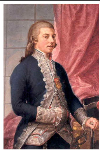
Manuel Godoy in 1790 1767-1851

Manuel Godoy was in 1784 op zeventienjarige leeftijd toegelaten tot de koninklijke garde. Hij studeerde Frans en Italiaans, maar had op het moment van zijn benoeming tot eerste minister in 1792 nog geen enkele politieke ervaring opgedaan. Wel was hij