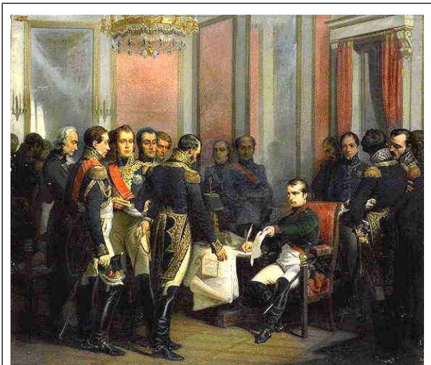
Ondertekening van het verdrag van Fontainebleau, 1807

Napoleon had zijn plannen voor een invasie op Engelse bodem in rook zien opgaan en daarom greep hij in 1806 naar een ander middel: een totale blokkade van de Engelse handel op het vasteland en het activeren van de continentale industrialisering om niet afhankelijk te zijn van de Britten. Dit was zeker geen onzinnig plan en leidde bijna tot een bankroet van de Londense handelaren en bankiers. In 1807 besloot Spanje de blokkade te steunen en werd het verdrag van Fontainebleau gesloten tussen Napoleon en Godoy waarbij besloten werd door de Fransen en Spanjaarden om Portugal te bezetten en te verdelen wanneer Lissabon niet bereid zou zijn de banden met Londen te verbreken en toe te treden tot het continentale blok.