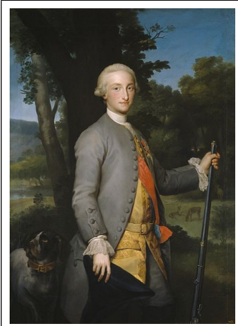
Prins Karel rond 1765

Karel IV werd geboren in 1748 uit het huwelijk van Karel III met Maria Amalia van Saksen. Zijn vader was toen nog koning van Napels en de prins bracht zijn vroege jeugd door in de gelijknamige stad. In 1759 werd zijn vader gekroond tot koning van