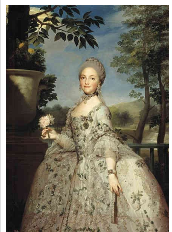
Maria Louisa van Parma in 1765 1751-1819

Spanje en verliet het gezin Italië. Karel III regeerde over het Spaanse imperium tot aan zijn overlijden in 1788 en zijn opvolger was toen dus al veertig. Op veertienjarige leeftijd huwde Karel IV zijn drie jaar jongere nichtje Maria Louisa van Parma die, opgevoed aan een Fransgezind hof, een groot liefhebster was van feestelijkheden en vermaak. Zij ontpopte zich als een krachtig vorstin die veel invloed had op de regering van het land en van wie gezegd werd dat zij er diverse minnaars op na hield. Eén ervan zou Manuel Godoy, de machtige gunsteling van de koning zijn geweest en enkele van haar kinderen zouden door hem zijn verwekt. Haar echtgenoot was grootgebracht aan een hof waar soberheid heerste en waar het landleven en de jacht hoger in aanzien stonden dan kunst en cultuur. Toch toonde Karel IV veel interesse in culturele zaken, hij sprak diverse talen, speelde verdienstelijk viool en verdiepte zich in technieken als meubel- en klokkenmaken. Koningin Maria Louisa van Parma was bijna voortdurend in verwachting. Uit vierentwintig zwangerschappen werden veertien kinderen geboren, waarvan er slechts zeven de meerderjarige leeftijd bereikten. Hun negende kind was kroonprins Ferdinand, geboren in oktober 1785. De eerste mannelijke nakomeling die zijn