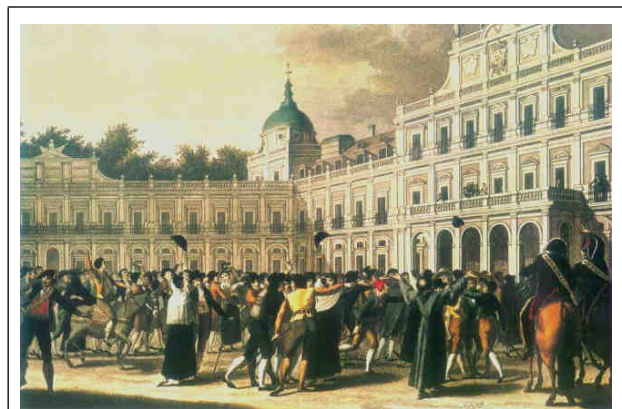
De opstand van Aranjuez, 1808

Eind 1807 leidde het verzet tot de samenzwering van El Escorial, die mislukte, maar in maart 1808, terwijl de koning op instigatie van Godoy feitelijk al bezig was te vluchten, kwam het tot een hoogtepunt met de opstand van Aranjuez waar de koning zich op dat moment bevond. Het was een opstand van dezelfde aristocraten van El Escorial, maar nu bijgestaan door gewone burgers, militairen