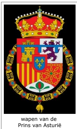
wapen van de Prins van Asturië

De Premio Príncipe de Asturias de las Letras bestaat sinds 1981 en wordt verleend aan een persoon, groep of institutie die door scheppend werk ofwel door onderzoek een belangrijke bijdrage heeft geleverd aan de Spaanstalige literatuur of linguïstiek, niet noodzakelijk door zelf in de Spaanse taal te publiceren. Naast de literatuurprijs bestaan op zeven andere terreinen prijzen onder dezelfde naam. Tot 1996 viel deze literatuurprijs de meeste jaren aan Spanjaarden toe, maar sinds 1999 werd de prijs alle jaren verleend aan een persoon buiten Spanje. De naam van deze prijs is afgeleid van een zeer oude titel, teruggaand tot de Middeleeuwen. De titel is nu een eretitel die gewoonlijk aan de Spaanse kroonprins wordt gegeven. De huidige drager van de titel is prins Felipe. Aan de Premio Príncipe de Asturias is een bedrag van 30.000 euro verbonden.