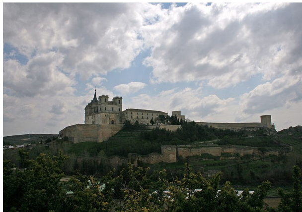
Monasterio de Uclés