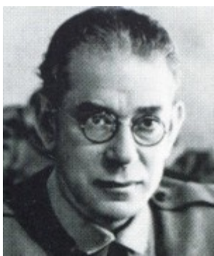
Emilio Mola 1887 - 1937

Het bombardement van Guernica was onderdeel van het offensief van de nationalisten om de noordelijke provincies in handen te krijgen. Gefrustreerd door het mislukken van de aanvallen op Madrid in 1936, besloot generaal Franco op advies van zijn staf en de Duitsers om het centrum van de aanval op het noorden te richten. Wanneer het noorden gewonnen zou worden, kreeg hij de beschikking over de belangrijke zware industrieën en mijnen. Voor de nationalisten waren er twee manieren om de noordelijke provincies te veroveren. Óf direct Oviedo en Santander aanvallen, óf eerst Bilbao innemen om vervolgens westwaarts te bewegen. Generaal Emilio Mola*), die het bevel voerde over de noordelijke legers, gaf de voorkeur aan de tweede optie. De eerste was vrijwel onuitvoerbaar vanwege het gebrek aan troepen en het zeer moeilijk begaanbare terrein.