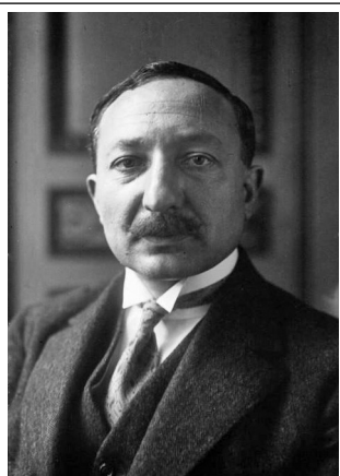
Yvon Delbos 1885-1956

tegenover hen, die den vrede willen verstoren. Stilzwijgen zal het aanzien en de toekomst van den Volkenbond slechts kunnen schaden. Del Vayo verklaarde dat sedert den laatsten keer, dat de Volkenbondsraad het Spaansche vraagstuk heelt behandeld, de Duitsch-Italiaansche inmenging in Spanje nog is toegenomen; deze inmenging leidde tot openlijke Italiaansche invallen in Spanje, tot den veldslag van Guadalajara en de vernieling van Guernica. Wat de controle betreft verklaarde Del Vayo dat deze na een maand toepassing hetzelfde onbevredigende resultaat heeft gehad als de niet-inmengingspolitiek.'