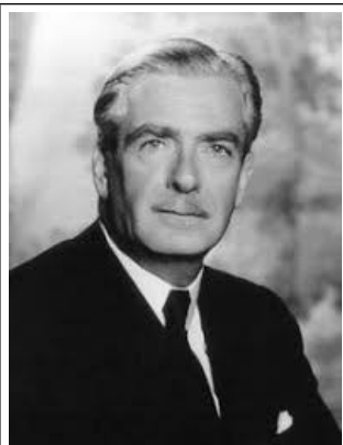
Antony Eden 1897-1977

Vlak na het uitbreken van de Burgeroorlog in juli 1936 besloten de grote West-Europese mogendheden zich formeel niet met het Spaanse conflict te bemoeien. Engeland moest niets hebben van wat zij zagen als het rode gevaar dat dreigde op te duiken wanneer de republikeinen de oorlog zouden winnen en gokten op een overwinning van Franco. Op initiatief van Frankrijk, dat sympathiseerde met de wettige linkse regering in Spanje, werd het Non-Interventie Comité opgericht waarvan ook de Sovjet-Unie deel uitmaakte en dat erop diende toe te zien dat er geen wapenleveranties plaatsvonden of buitenlandse strijdkrachten werden ingezet. Engeland bekleedde het voorzitterschap van dit comité dat uitblonk door hypocrisie. Franco werd geen strobreed in de weg gelegd, Duitse en Italiaanse hulp aan Franco ging gewoon door. Dit wetende trok ook de Sovjet-Unie zich nergens iets van aan en leverde wapens aan de linkse regering die tevergeefs had aangeklopt bij de westerse